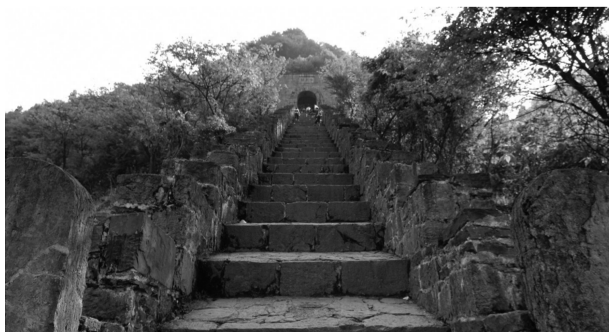
三十六步和飞虎关