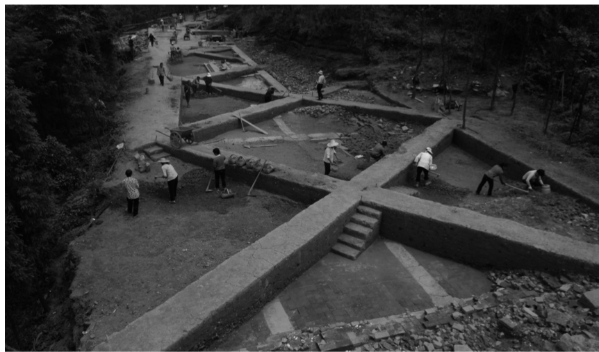
新王宫龙位坪发掘中