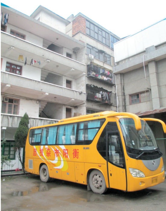
文化部奖励给衡阳市杂技团的大客车