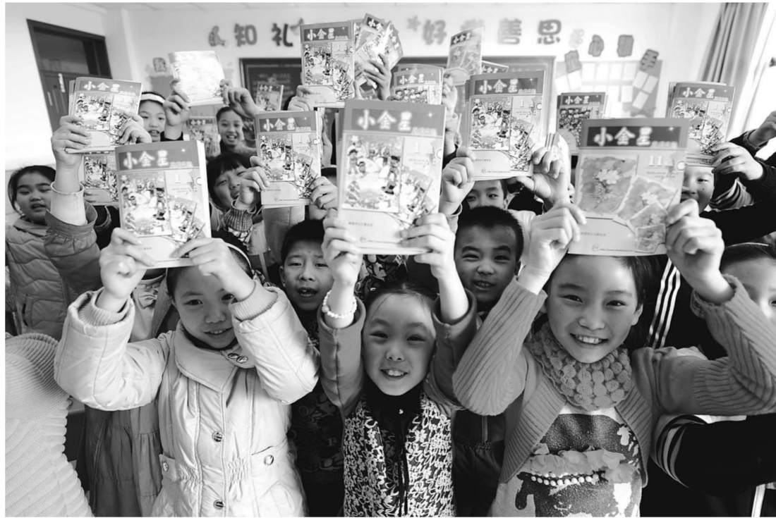
为丰富农民工子女课余文化生活，3月7日，山东省威海团市委在当地新都小学举行了“关爱农民工子女爱心赠阅活动”。据悉，该项活动自2010年启动以来，已有6000多名农民工子女从中受益。图为新都小学的农民工子女在展示爱心赠阅的“小金星报”。

随着“数字图书馆推广工程”建设的推进，国图将继续深化和完善电视图书馆项目的全国性合作，积极推动数字图书馆在“三网”融合环境下文化内容数字化、文化传输途径数字化和文化服务模式数字化的发展，为社会大众提供更加便捷的互动高清视听体验。（图文）