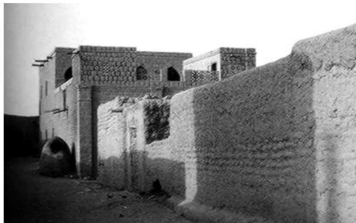
基尔瓦基斯瓦尼遗址和松戈马拉遗址