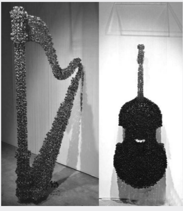
纽扣打造的逼真艺术品