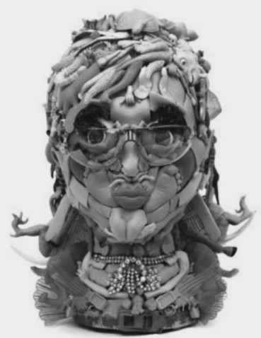
旧玩具拼出的艺术品

报道称,弗雷娅的创意来源十分广泛,如好莱坞动画片《玩具总动员》三部曲、意大利画家朱塞佩·阿尔钦博托及其作品《水果人》等。