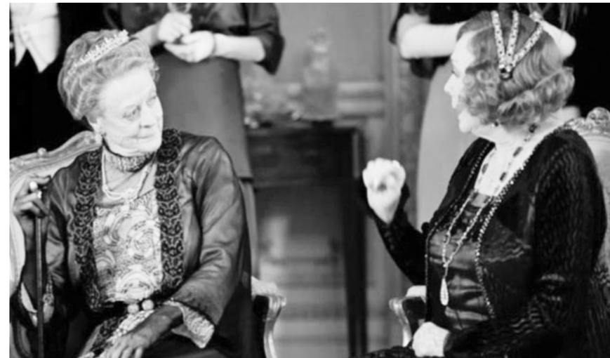
好莱坞女星雪莉·麦克雷恩(右二)入住“唐顿庄园”

回顾亨利·鲁瓦耶特12年的馆长任期,“卢浮宫阿布扎比”无疑是其最具争议的项目。他带领法国国际博物馆科学委员会,一直为这个项目努力协调着。将于2015年向公众开放的“卢浮宫阿布扎比”,是一座由法国人设计的博物馆。阿联酋将以近10亿欧元作为交换,通过协议借用法国的艺术品,其中4亿欧元支付给卢浮宫。(樊焱 编译)