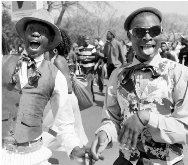
参加狂欢节的南非青年 (资料图片)

策,建立了一些新的国家机构,如国家艺术委员会、表演艺术委员会、国家影视基地、国家文化遗产委员会等。此外,还有来自社会的投资,以及利用海外友好伙伴对国际艺术和文化方面的直接投资。艺术家们可以通过“国家彩票分配信托基金”“艺术和文化信托”“南非商业和艺术”等形式获得资金。