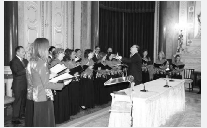
“茉莉花”合唱团表演。

本报讯 4月2日,由葡萄牙“中国观察”协会主办的“葡萄牙—中国:文化交汇,2013—2014”活动发布会暨“面对面——中国艺术在海内外的影响”作品展开幕式在里斯本市政厅举行。