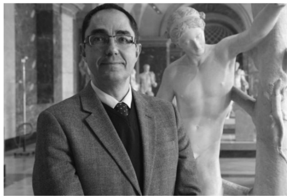
卢浮宫博物馆新任馆长让-吕克·马尔迪内。

由于卢浮宫管理委员会章程中明确规定主席要具备专业能力,因此,政治人物和国家行政学院的毕业生只能望洋兴叹。据悉,卢浮宫内部和其他博物馆各有4人进入了法国文化部的初选,他们都向文化部长提交了施政方案。3月14日,文化部长向总理和总统提交了2人入选名单,并表示倾向于由女性执掌卢浮宫。总统府权衡后,又请文化部长加上一个名额。4月3日,卢浮宫新掌门人终于尘埃落定。