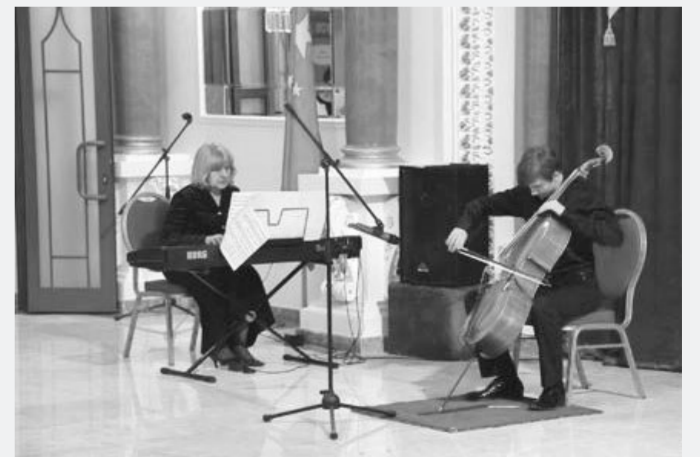
俄罗斯少年带来大提琴独奏。

本报讯 日前,莫斯科中国文化中心与俄中友好协会联合举办“中俄少年儿童联欢活动”。100余位中俄嘉宾出席了活动。