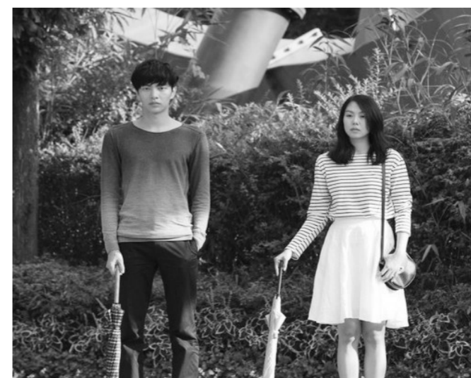
《恋爱的温度》视角颇具新意

出版了一本诗集《枕着秘密入睡》,并计划着再推出3本书。他说:“我很担心自己错过什么新鲜事。我自认为走在自助出版的前列,现在需要做的是继续推广我的电子书。”