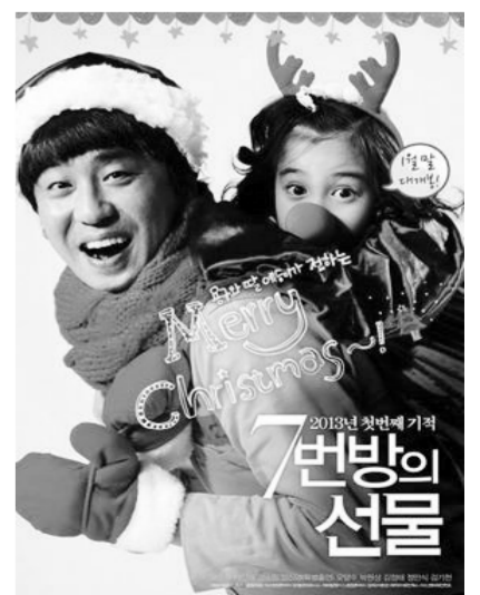
《七号房间的礼物》讲述父女亲情