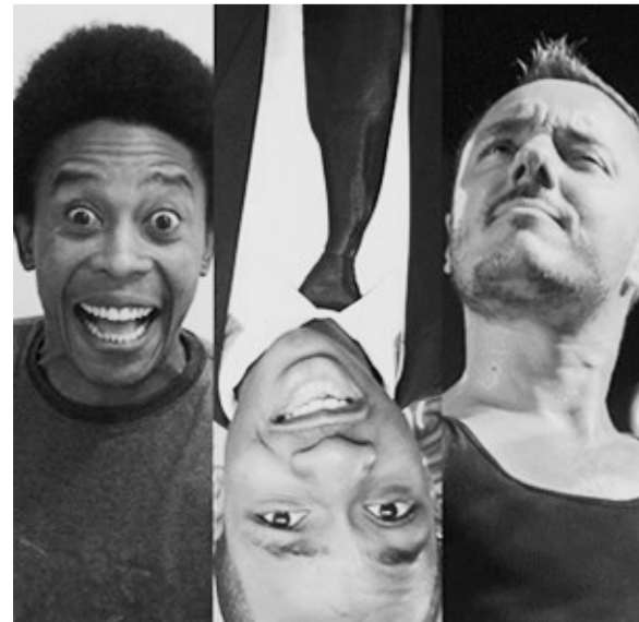
哈拉雷艺术节演出宣传海报

一年一度的哈拉雷国际艺术节于4月30日至5月5日在津巴布韦首都哈拉雷举行。创办于1999年的哈拉雷国际艺术节是津巴布韦最大的艺术盛会,以全面的艺术形式展示世界范围内的优秀文化艺术成果,如戏剧、舞蹈、音乐、马戏、街头表演、视觉艺术等。