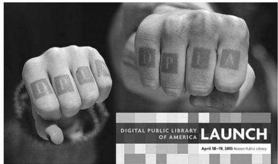
美国公共数字图书馆海报及它的支持者