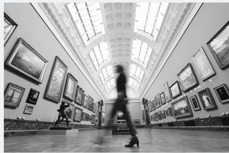
一名参观者穿过重新布局的泰特英国美术馆

本报 5月14日,位于伦敦的泰特英国美术馆举办名为“穿行英国艺术”的展览,向公众展示其耗时3年、耗资4500万英镑进行的大规模重新布局成果。此次重新布局旨在以传统的编年方式,全面呈现自1545年以来近500年的英国艺术变迁史。