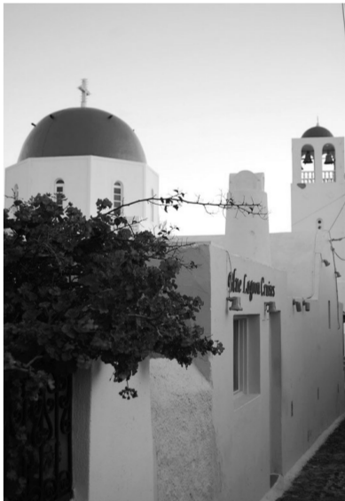
圣托里尼岛街角一景

我们只好朝着差不多的方向一直走,一只黑猫若即若离地跟在后面。正是从这一刻开始,我发现了圣托里尼岛另一个令人着迷的地方,那就是这里的猫猫狗狗。不知道它们的主人是谁,也不知道它们的家在哪里,几天内随我们走回洞穴屋的就不止一只。我和朋友舍弃了去很多著名