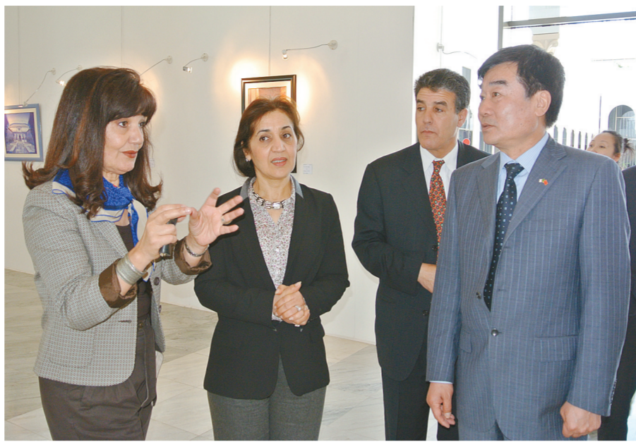
阿尔及利亚文化部部长吉哈杜(左二)陪同中国文化传媒集团董事长刘承莹(右)一行参观展览。