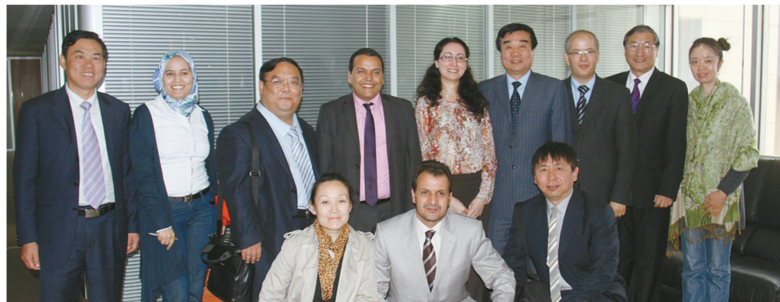
与摩洛哥旅游部官员工作会议之后合影。