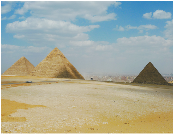
近年来,沙漠文化旅游成为埃及、摩洛哥等北非国家的旅游新亮点。