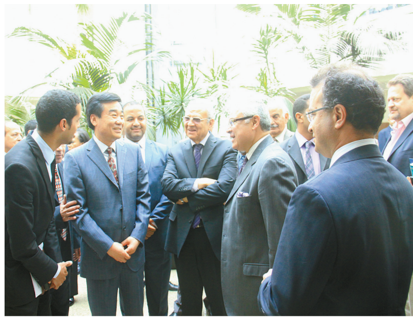
埃及旅游部部长扎尔祖(右二)、通讯与信息技术部部长赫勒迈(中)在开罗智能村会见中国文化传媒集团董事长刘承莹(左二)一行。