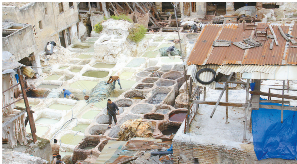
摩洛哥菲斯古城古老的皮革制作工艺令人惊叹。