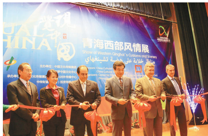
4月21日,中埃两国嘉宾为“视觉中国——青海西部风情展”剪彩。