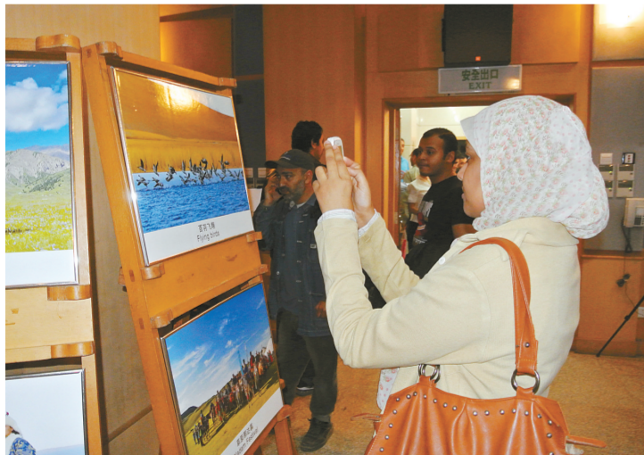
埃及观众聚精会神观看于4月21日在开罗中国文化中心开幕的“视觉中国——青海西部风情展”图片。