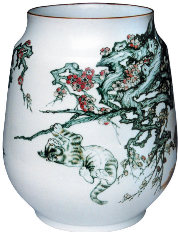
黄水泉釉下装饰《猫戏图》瓷瓶