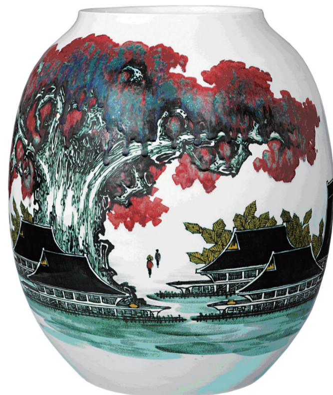
黄水泉釉下装饰《乡村秋意》瓷瓶