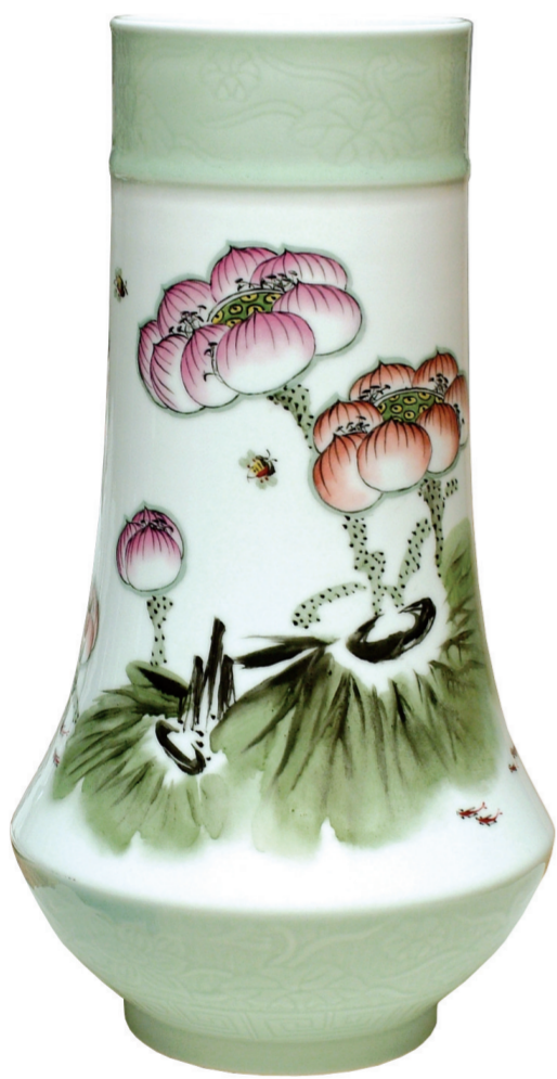
黄水泉釉上装饰《荷花》瓷瓶

中久久回荡。岸上晨归的村民沿着石板小路拾级而上，向着村居走去。这两件“乡情”瓷画作品，无论在装饰形式还是装饰材料方面，笔者都作了一些有益的探索。在画面布局上，注重画面的留白，以表现陶瓷的材质美；在技术上，运用釉下工兼写的装饰手法表现画面物象，注重线条的表现力，并赋予其新意。釉下多彩装饰材料使整件作品用笔流畅，苍劲有力。作品画面色彩呈现清雅明快之感，令人赏心悦目。