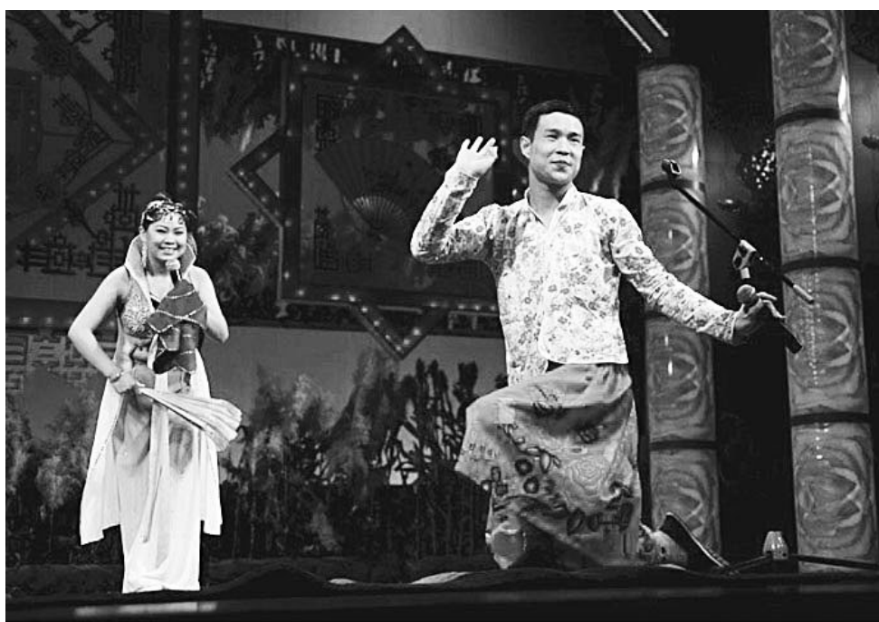
近年来,大批二人转演员逐渐被观众所熟知。(资料图)

茂公、薛丁山、樊梨花和姜桓;《马前泼水》,也是一前一后是拉场戏,中间崔氏嫁给赵石匠那一幕,他们由富变穷,全是二人转“一人演多角”的演技;《马前泼水》场面最多,改编者虽然已经分开固定的三个“场”,但这些“场”,也只是不过是戏剧性情节的切割,并没有凝固时空。如第二场“打柴得宝”,还要分“山上遇险”和“山下张别古家”: