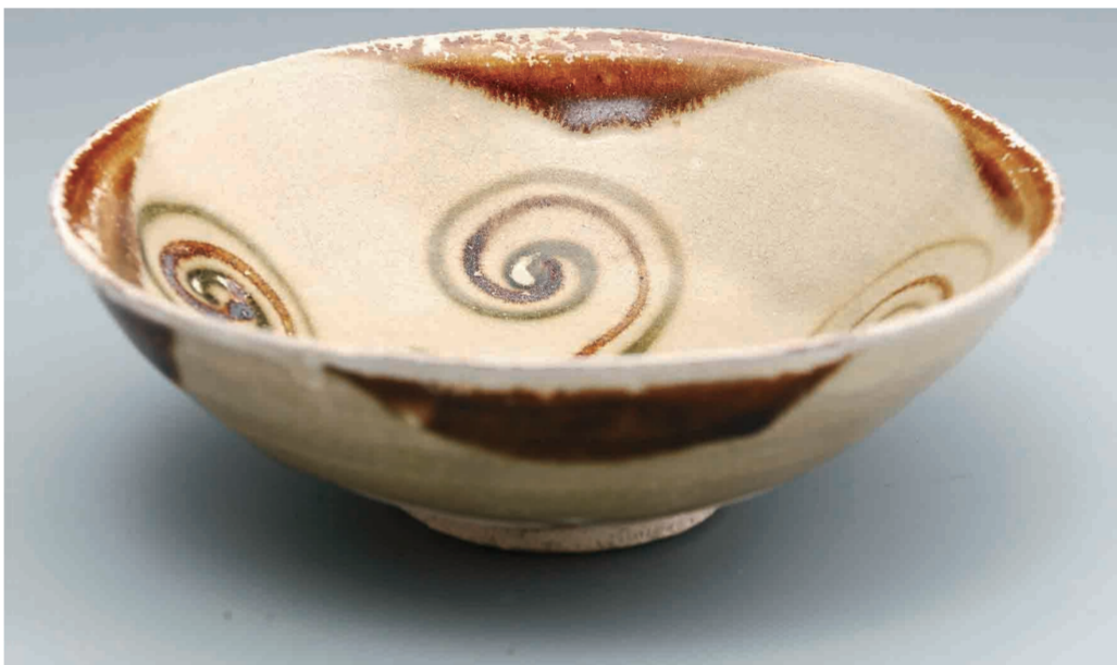
唐代褐绿彩花草纹碗

面。20世纪50年代以来，随着考古发现与研究的深入，尤其是沉没在印尼的“黑石号”打捞后，瑰丽的彩瓷长沙窑备受瞩目。大家一致认为，长沙窑、浙江越窑、河北邢窑是唐代并驾齐驱的三大民窑。