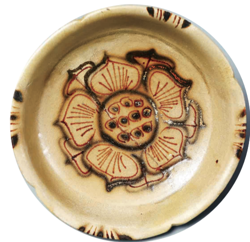
唐代褐绿彩莲花纹碗