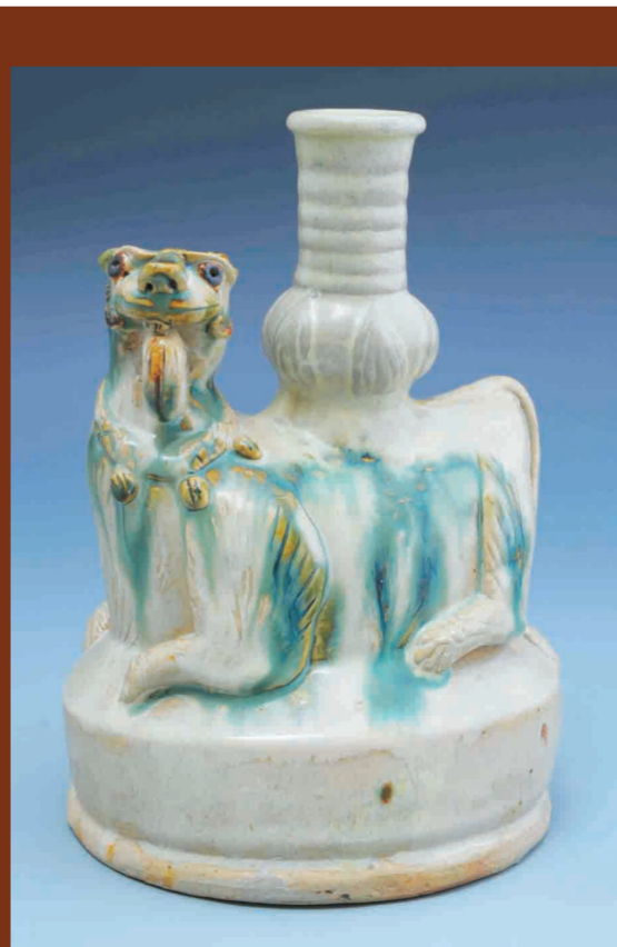
唐代白釉褐绿彩狮型烛台