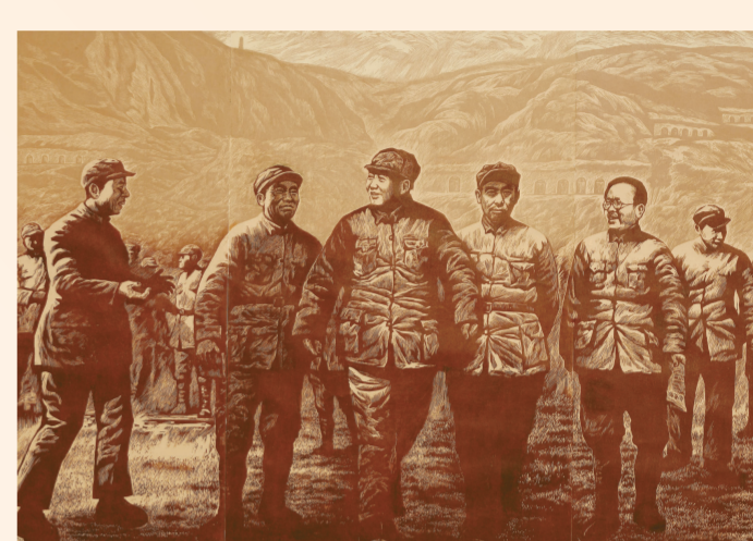
咱们领袖毛泽东(版画) 220厘米×150厘米 洪涛