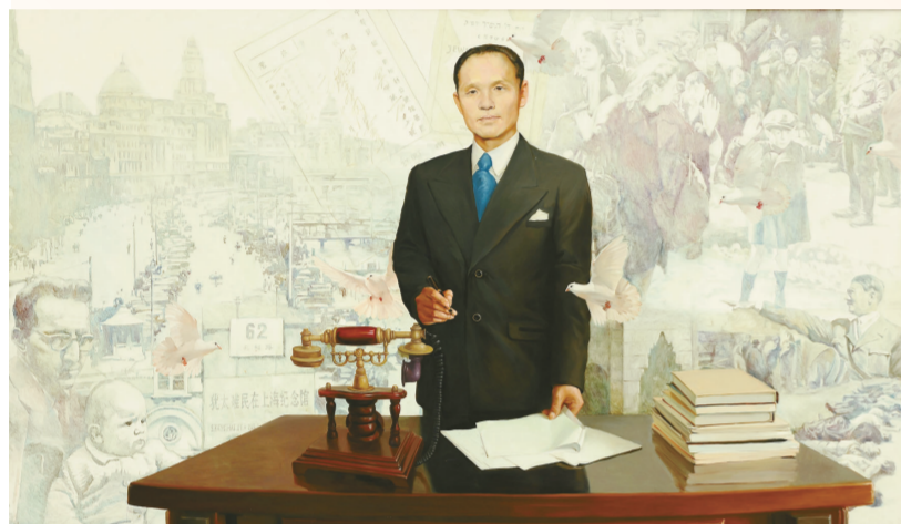
生命签证(油画) 300厘米×190厘米 欧阳波 陈年华

“湖南百年”重大历史题材美术创作工程作品展于8月6日在湖南省艺术馆举办。这是由湖南省文化厅组织,省文化厅社文处、省群众艺术馆和省文化艺术基金会共同承办的参与画家最多、作品尺寸最大、用时最长的一次主题性美术创作工程。