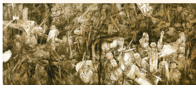
长沙“抢米”风波(国画) 448厘米×172厘米 吴志立