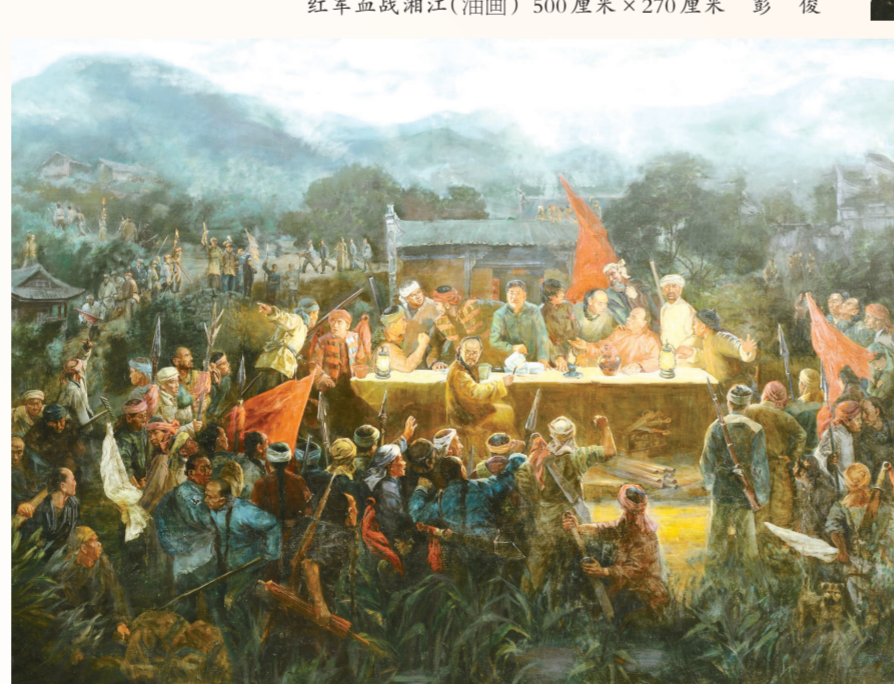
萍浏醴起义(油画) 320厘米×460厘米 张丽颀