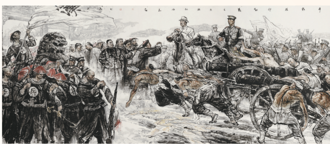
辛亥长沙起义(国画) 500厘米×195厘米 谢伦和