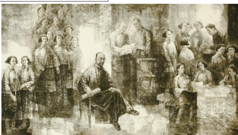
朱剑凡创办周南女学(国画) 422厘米×218厘米 邹力农