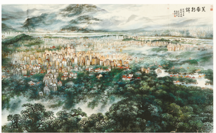
芙蓉朝晖(国画) 470厘米×270厘米 王金星