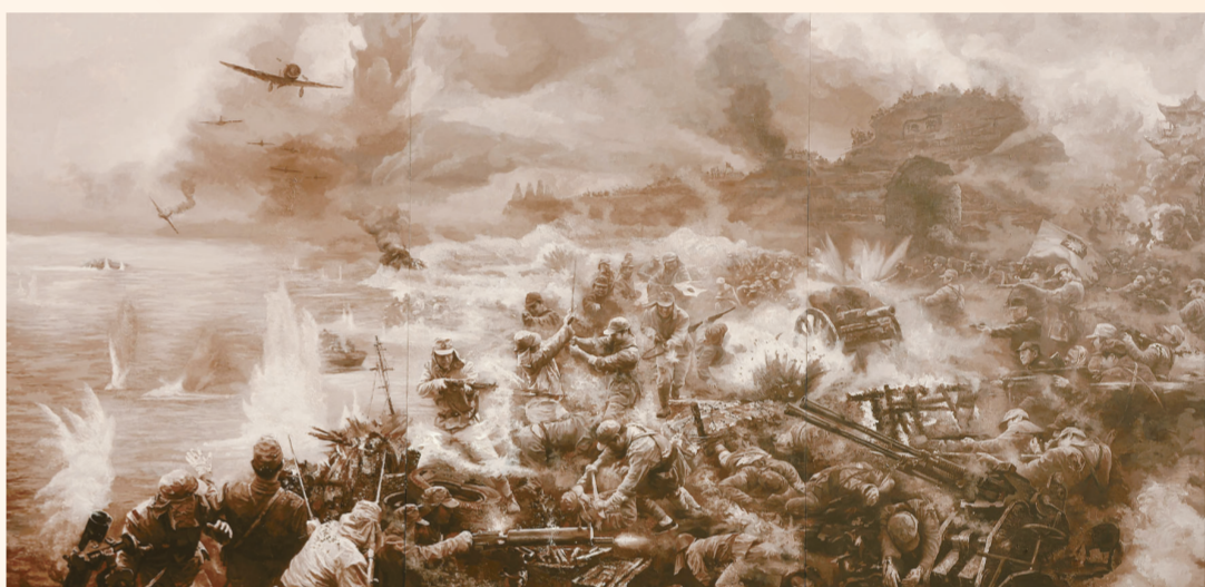
常德保卫战(油画) 540厘米×290厘米 袁俊灵 曹颖 熊长青