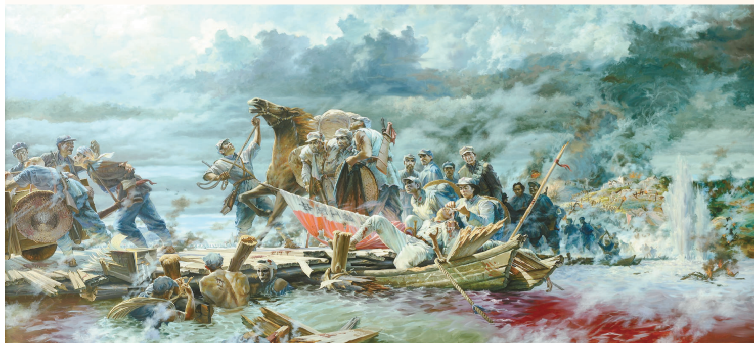
红军血战湘江(油画) 500厘米×270厘米 彭俊