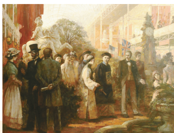
郭嵩焘出使英国(油画) 300厘米×238厘米 门简成