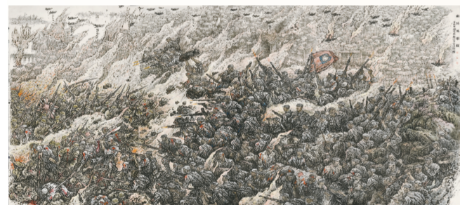
衡阳保卫战(国画) 589厘米×295厘米 顾志武 赖尚平 李清白