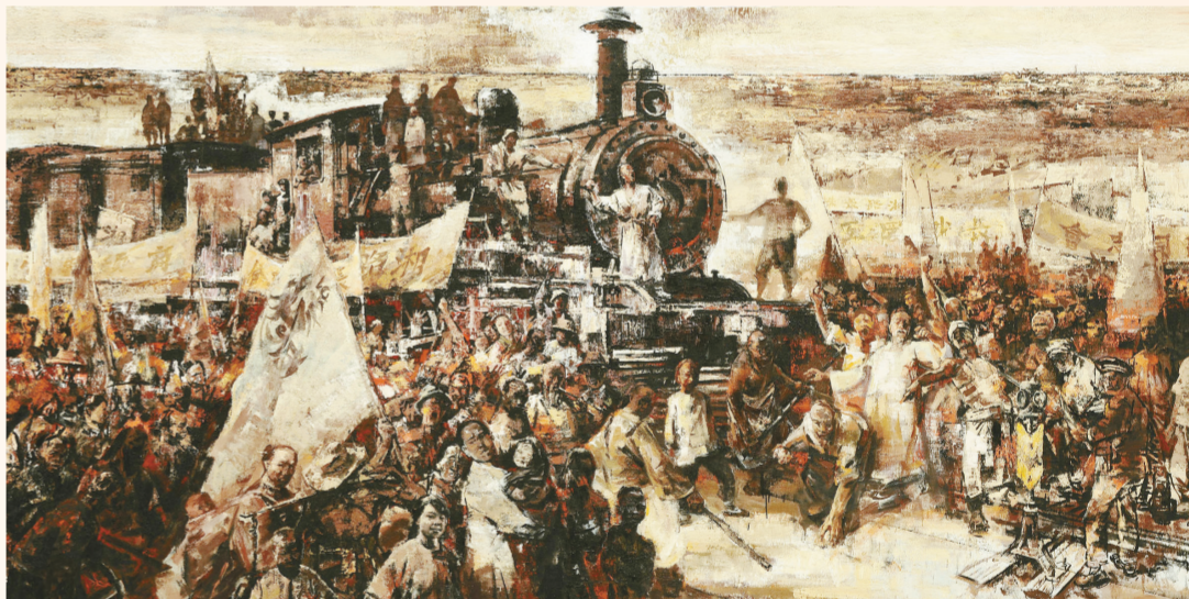
湖南保路运动(油画) 450厘米×250厘米 续鹤贤