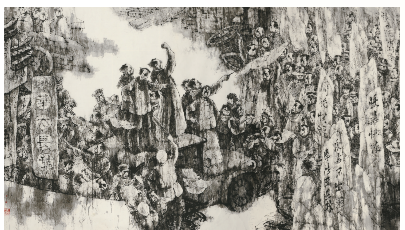
五四运动在湖南(国画) 390厘米×130厘米 周志宏