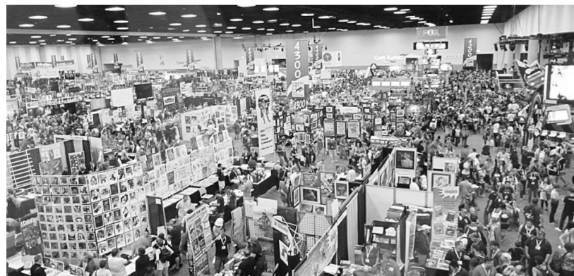
人潮汹涌的2013圣地亚哥漫画节

美国圣地亚哥漫画节是西半球规模最大、全球第二大的漫画展，仅次于法国的昂古莱姆国际漫画节，今年漫画节于7月21日结束。(舒弥)