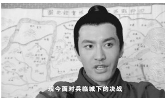
“岳飞”北伐地图中出现了“四野”字样。