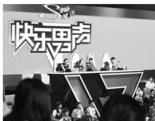
盆凉水。音乐选秀节目被一纸限令泼了。

调控之前，关于暑期音乐选秀节目扎堆的争议已不绝于耳。有媒体统计，目前在各大卫视竞相播放的此类节目大小小有20多个。