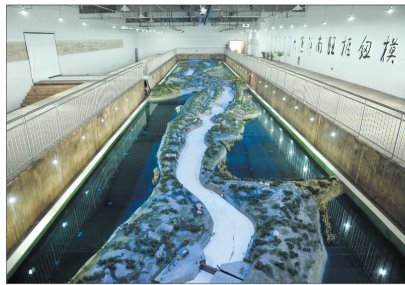
南旺分水枢纽考古遗址公园水科技馆内景