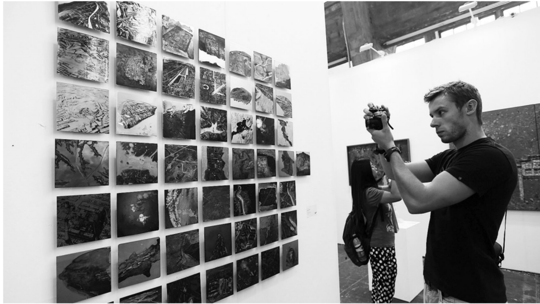
8月21日,2013年度“青年艺术100”项目在北京798艺术区启动。超过120位中韩青年艺术家的360余件作品在798艺术工厂、圣之空间艺术中心、凤凰艺都北京798艺术空间同时亮相。本年度“青年艺术100”项目参展的皆为1975年(含1975年)之后出生的青年艺术家,其多为专业美术院校出身。图为观众参观展览。

易介中指出,建议此类项目吸收学者、民众参与进来,并及时进行公示、公告,“西安地处内陆,文化氛围浓郁,如果项目的开发带动区域能形成国际化的生活方式,让当地老百姓受益,社会就不要太敏感。”