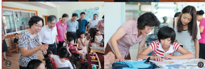
① 山东省委宣传部副部长、省文化厅厅长、“十艺节”组委会常务副秘书长徐向红(右)将“美丽中国梦·多彩十艺节——维也纳和平之夜童声音乐会”演出门票交到济南市儿童福利院负责人手中。 ② 徐向红(左二)等与孩子们互动交流。 ③ 山东省文化厅副厅长、“十艺节”组委会外演及演艺产品交易部部长李国琳(左一)欣赏孩子们的十字绣作品。