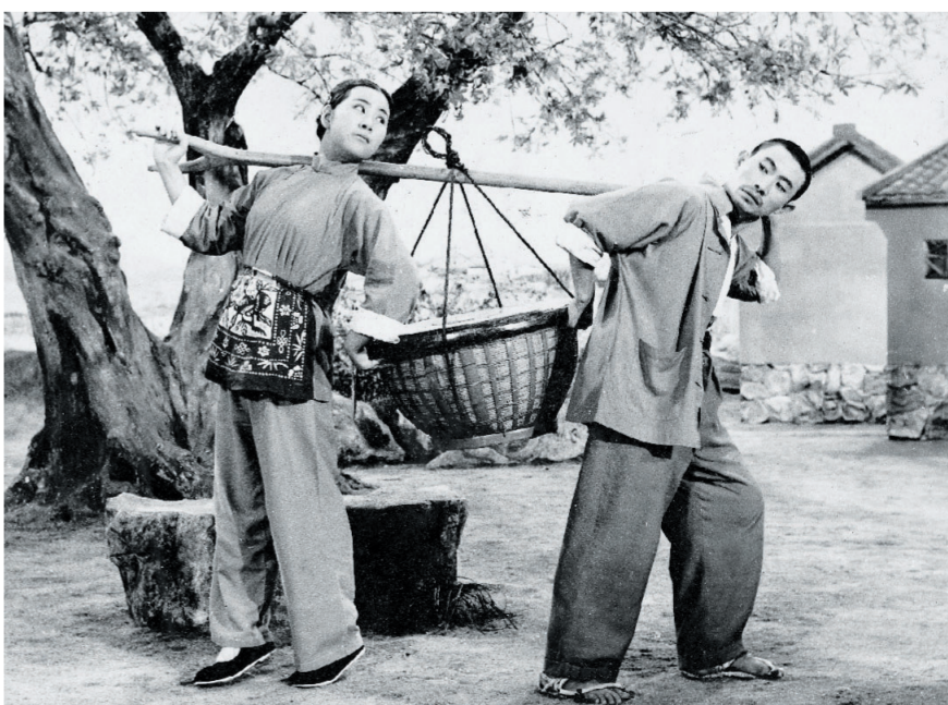
经典花鼓戏剧目《打铜锣》剧照。