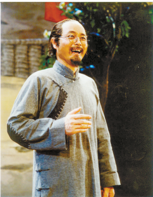
国家级精品剧目、大型现代戏《老表轶事》剧照。