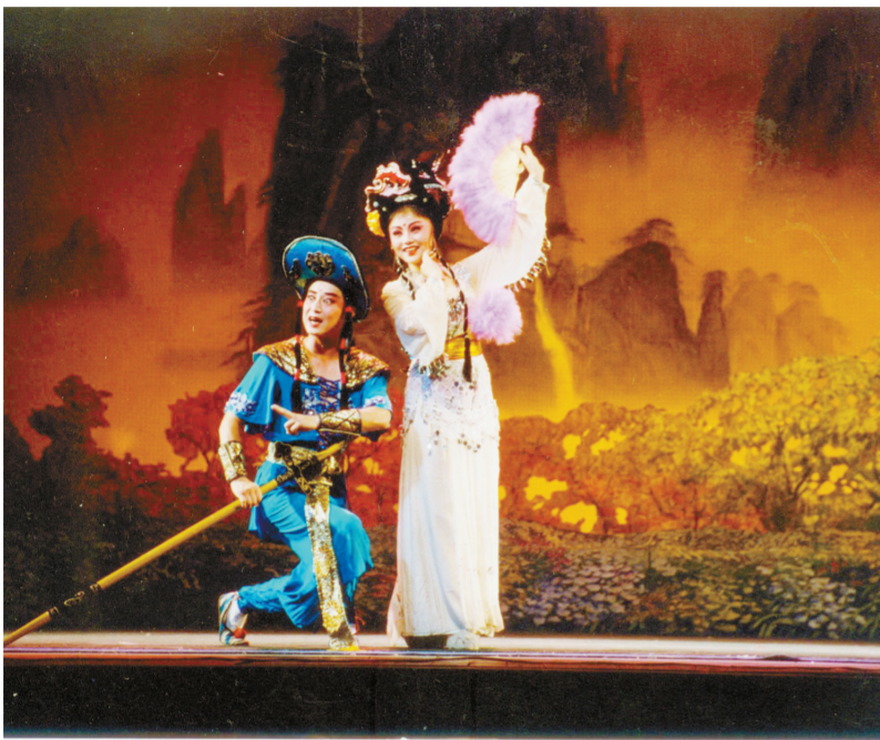
花鼓戏经典传统剧目《刘海戏金蟾》。

中心始建于1953年，至今已走过了60年光辉岁月，作为湖南省直重点院团，经过历代花鼓戏艺术家的执着追求，在继承传统的基础上，博采众长，闯出了独具风格的“省花路子”，形成了“省花”流派，在三湘大地上产生了深厚的观众基础和广泛的社会影响，是文化部表彰的全国编演戏曲现代戏成绩卓越的八面红旗之一，创作了一大批脍炙人口的优秀剧目，曾多次荣获中宣部“五个一工程”优秀剧目奖，文化部文华奖、文华大奖等多项国家级奖项，两次入围国家舞台艺术精品工程提名剧目，并获2007—2008年度国家舞台艺术精品工程“十大精品剧目”。形成了以《刘海戏金蟾》、《三里湾》、《打铜锣》、《补锅》、《沙家浜》、《野鸭洲》、《牛多喜坐轿》、《八品官》、《喜脉案》、《桃花汛》、《乡里警察》、《老表轶事》、《走进阳光》、《作田汉子也风流》等为代表的一大批在全国有影响的优秀剧目，中心创作演出的《刘海戏金蟾》曾出访欧美，轰动海外。2005年，文化部授予该中心“全国文化工作先进集体”光荣称号，2011年由中心申报的长沙花鼓戏列入国务院颁布的第三批国家级非物质文化遗产名录。六十载湘音不辍，一甲子湘韵流转，中心不仅见证了湖南戏曲变革的历史，更成就了湖南地方小戏的辉煌。