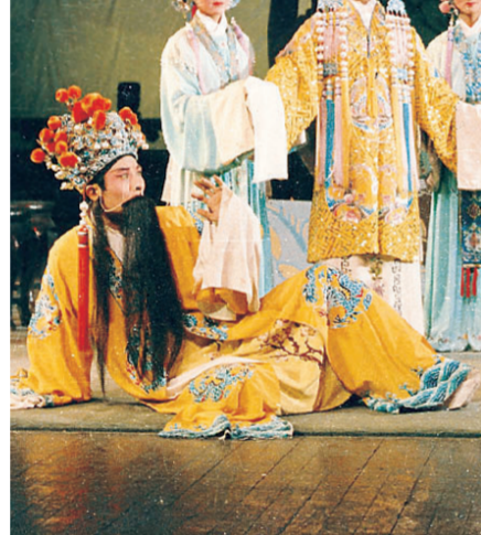
第一部戏曲电视飞天奖获奖作品、新编历史剧《喜脉案》剧照。

60多年来戏曲现代戏创作已经积累了一定的成功经验和创作出一批有重要影响的作品，“省花路子”就是一个重要的例证。我们期待有更多更好的现实题材新剧目问世。我们同样期待“湖南省花”从六十华诞再出发，创造新辉煌。