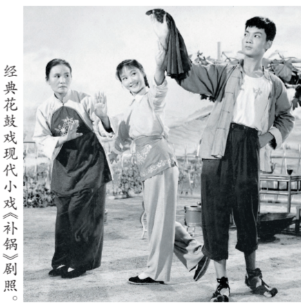
经典花鼓戏现代小戏《补锅》剧照。

长期以来为湖南花鼓戏发展做出卓越贡献的演员、导演将在本次展演中参与演出或指导。展演节目有家喻户晓、曾轰动海内外的花鼓戏经典传统剧目《刘海戏金蟾》，第一部戏曲电视飞天奖获奖作品、新编历史剧《喜脉案》，湖南省第一台国家级精品剧目大型现代戏《老表轶事》和《补锅》、《送表妹》、《讨学钱》等8台经典小戏片段。展演将首次演出史实性展现湖南省花鼓戏剧院60年辉煌历史的纪录剧《亮相》。如总导演何艺光所言，这是一部“非传统戏剧体裁的戏剧、非戏剧结构的戏剧、介乎影视与戏剧共有叙事方式的戏剧、没有任何经验可循的舞台‘纪录剧’”。10月9日开始，这部由湖南花鼓戏保护传承中心全体演职员参演的大型纪录剧将和其他展演的精品节目一起成为湖南省花鼓戏保护传承中心回馈社会、回馈观众的新“亮相”。