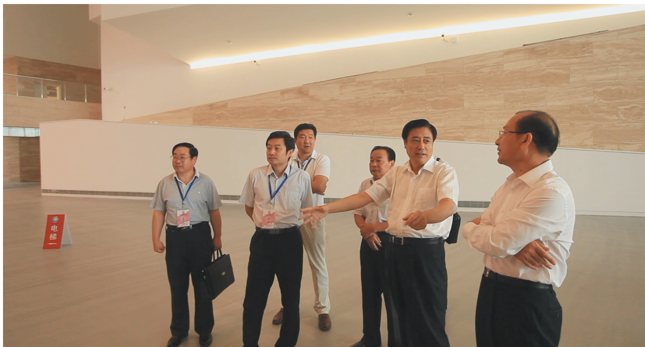
文化部副部长董伟(右二)、山东省副省长李锡畴(右一)及文化部艺术司副司长冯迪等参观山东省美术馆

这种宏观视野的确立，为李立的设计打开了更广阔的想像空间。李立从这块场地周边的基本地形特征寻找灵感，“南部的泰山余脉在此与城市平缓交接，构成历史文化名城济南的重要地理特征。于是，确立了以‘山·城’为主题，从三层的山形逐渐过渡到五层的方整体量的基本构思。在‘山·城’