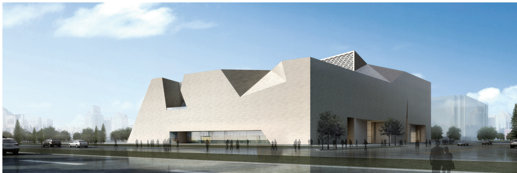
美术馆外景(效果图)

目前建成的山东省美术馆一至四楼都有咖啡厅，地下有下沉式餐厅。还设置了艺术衍生品商店、书店、儿童托管区、学术报告厅、美术培训教室等。观众在馆里待一天不渴不累不烦。徐馆长介绍说“我在卢浮宫参观时发现男厕所前排队的人一般在10到15人，女厕所前排队人数在30至40人。所以我让设计师把女卫生间蹲坑数量设计到男卫生间的两倍，设计师反问我是如何想到的，我玩味的回答他：等你当馆长时就能想到了。”目前建成后的一楼男卫生间蹲坑5个，女卫生间是14个。