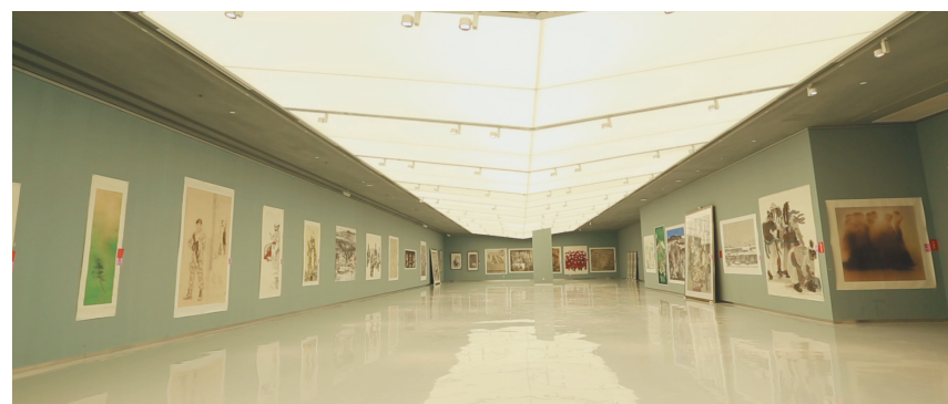
现代的灯光设计，使展览达到最佳效果(实景图)