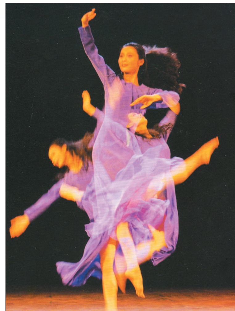
香港陶瓷舞蹈晚会