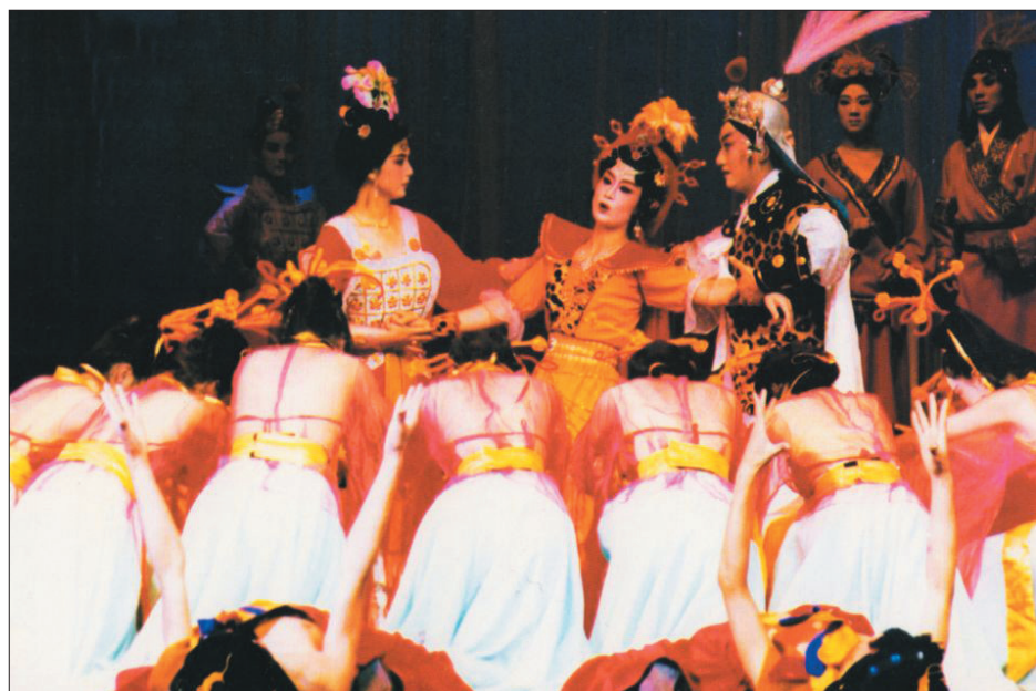
新编秦腔历史剧《白花曲》剧照 甘肃省秦剧团创作演出