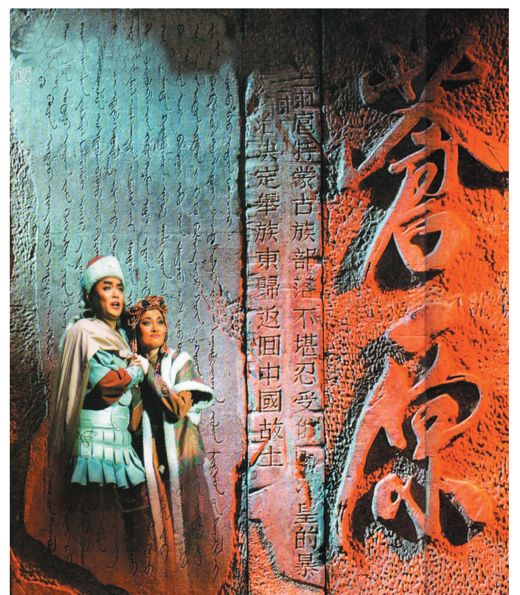
辽宁省歌剧院演出《苍原》剧照