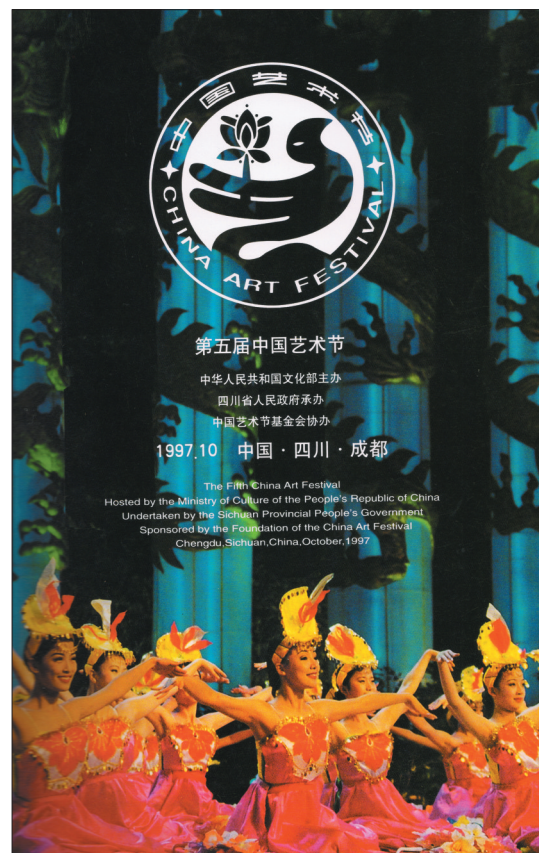
第五届中国艺术节海报