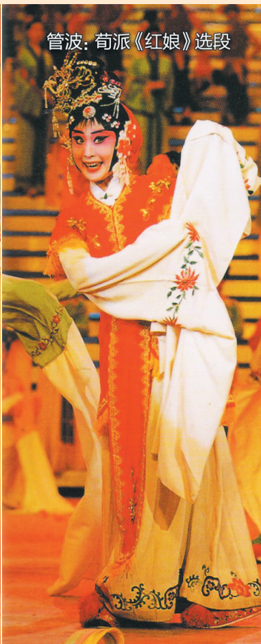
管波: 荀派《红娘》选段