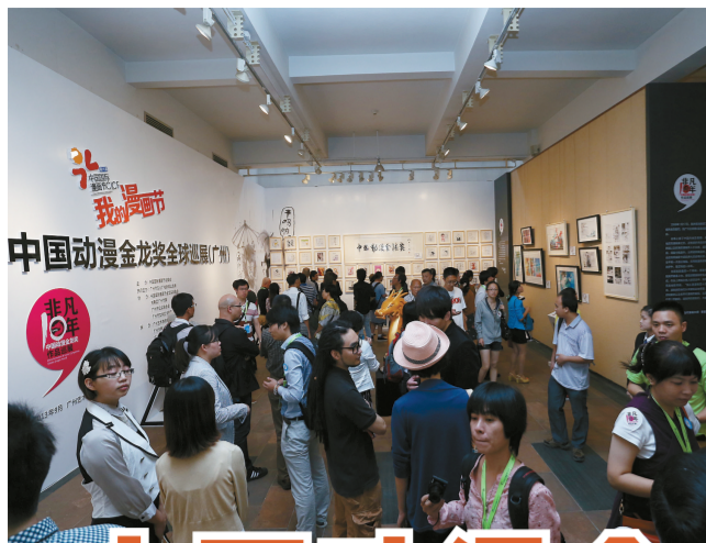
非凡十年·中国动漫金龙奖作品巡展现场