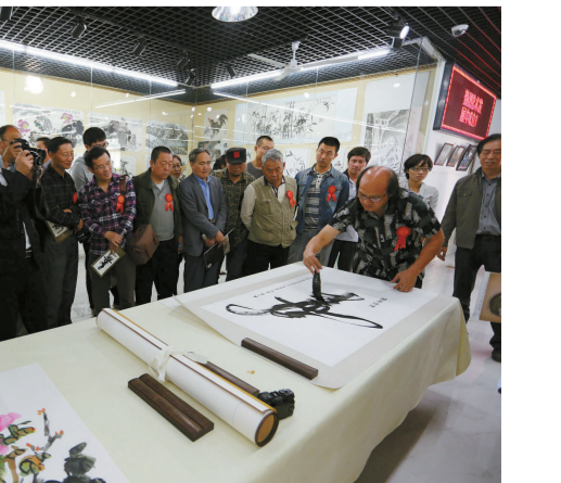
联谊会上书画家们挥毫创作