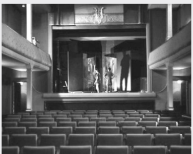
最古老电影院“伊甸园”

据英国《每日电讯报》日前报道,全球最古老电影院——法国拉西约塔市的伊甸园电影院经过修缮后,于10月9日重新对外开放。