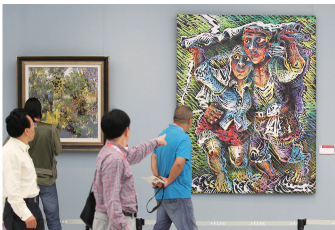
观众品评参展作品

“有那么一段时间，美术界出现一种虚无主义，不关注现实，不关注生活，这次的作品接地气的多了，比如关注老百姓、普通士兵的生活，还有一些反映红色题材的，都画得很