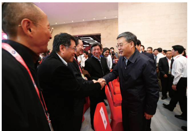
山东省省长刘东生与美术界专家学者一一握手