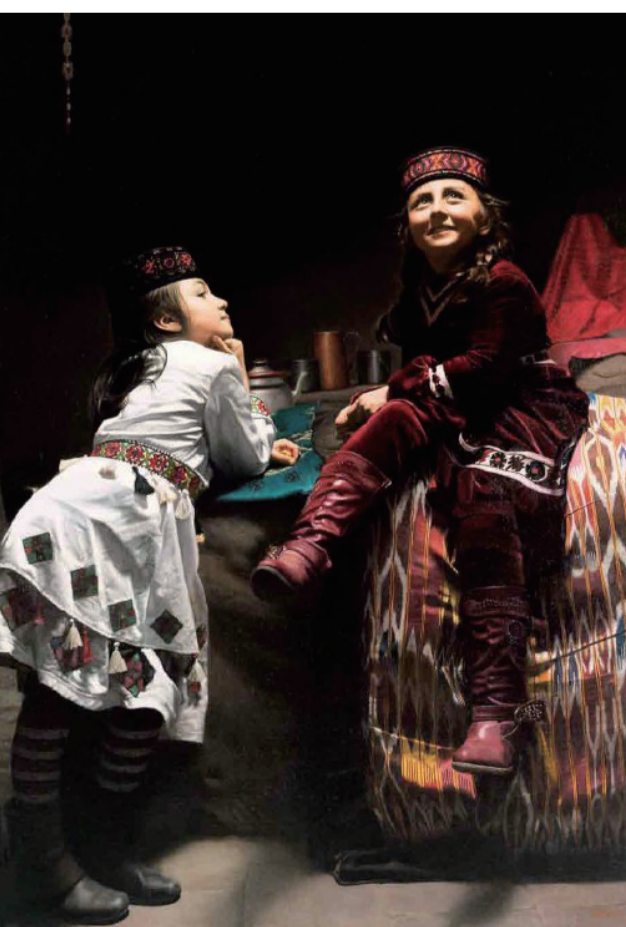
帕米尔小天使(油画) 210×148厘米 张绍航