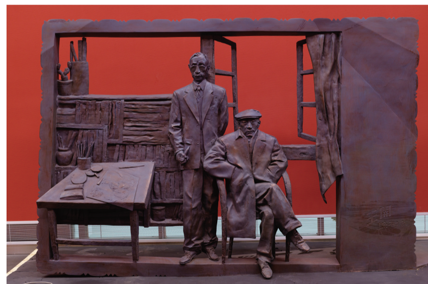
林风眠和傅雷(雕塑) 250×120×200厘米 罗小平

“在全国很多美展比较起来，此次参展的国画作品在水墨表现的技法上有很大的突破，传统的笔墨在表现形式上又有现代的观念，但又不是单纯的炫耀笔墨或玩弄技巧，有些作品把写意与材料技法融合得特别好。”王学辉说。