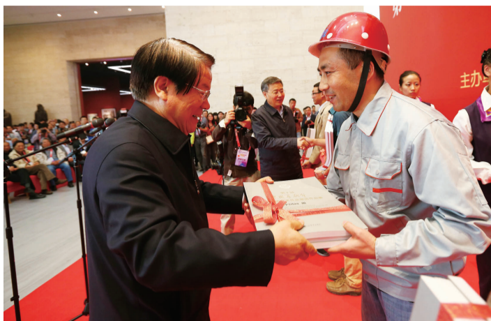
文化部部长蔡武把《全国优秀美术作品展览画册》送到山东美术馆建设者手中