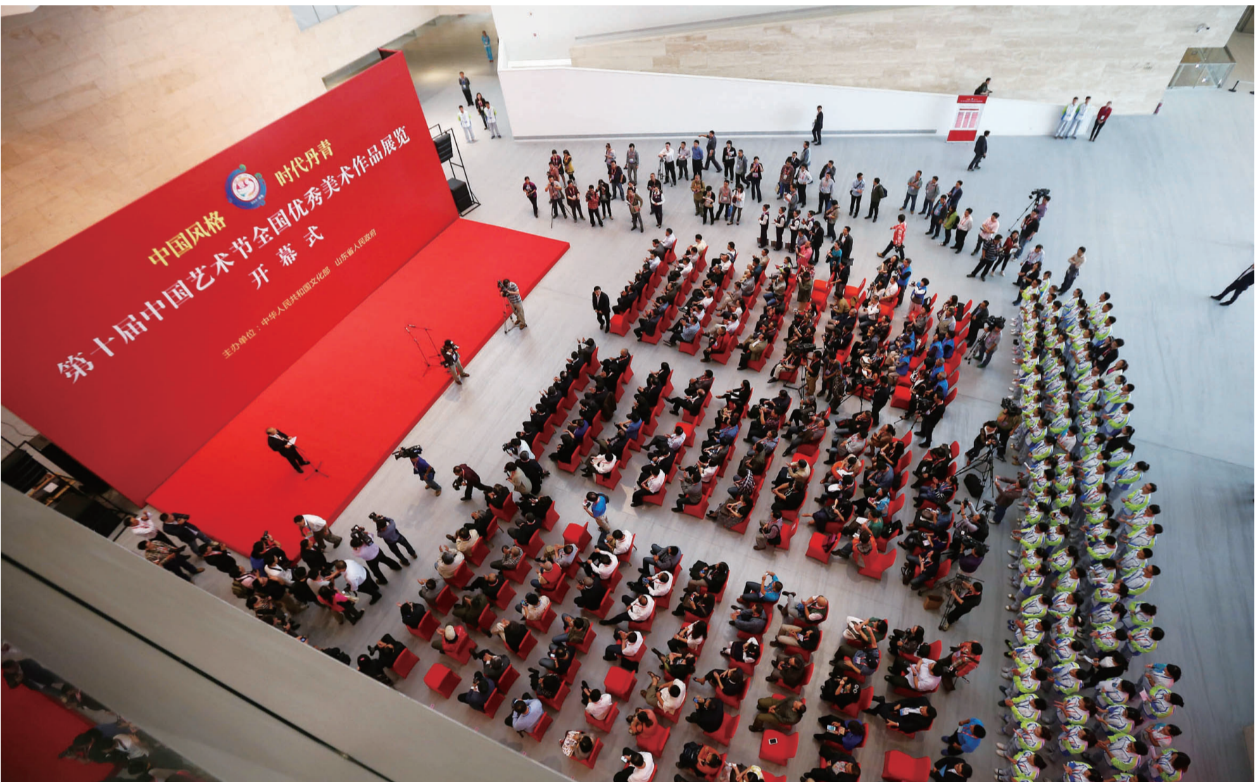
十艺节全国美术作品展览开幕现场

“有那么一段时间，美术界出现一种虚无主义，不关注现实，不关注生活，这次的作品接地气的多了，比如关注老百姓、普通士兵的生活，还有一些反映红色题材的，都画得很