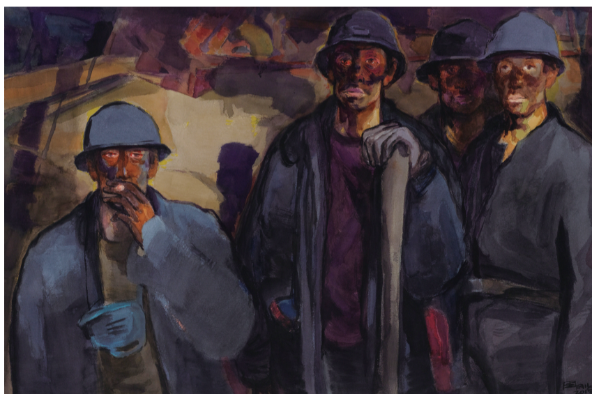
当班矿工(水彩) 170×190厘米 周刚