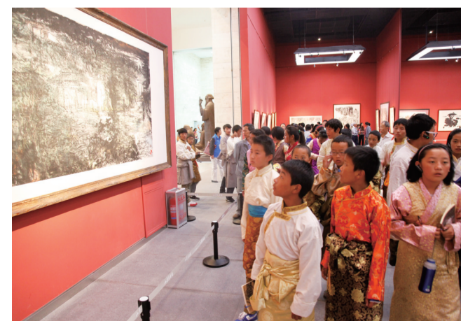
少数民族观众参观专场