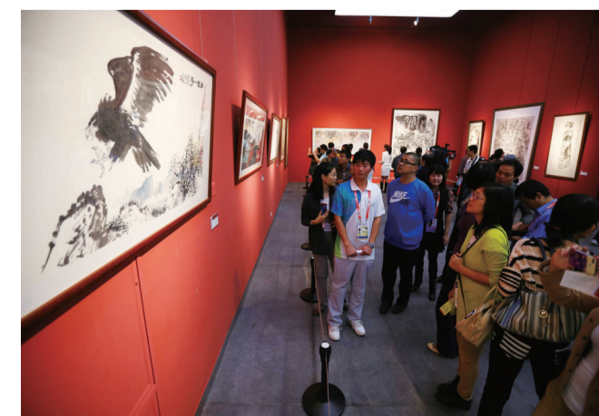
观众在本届展览最年轻参展者孙其峰画家的作品前驻足观看