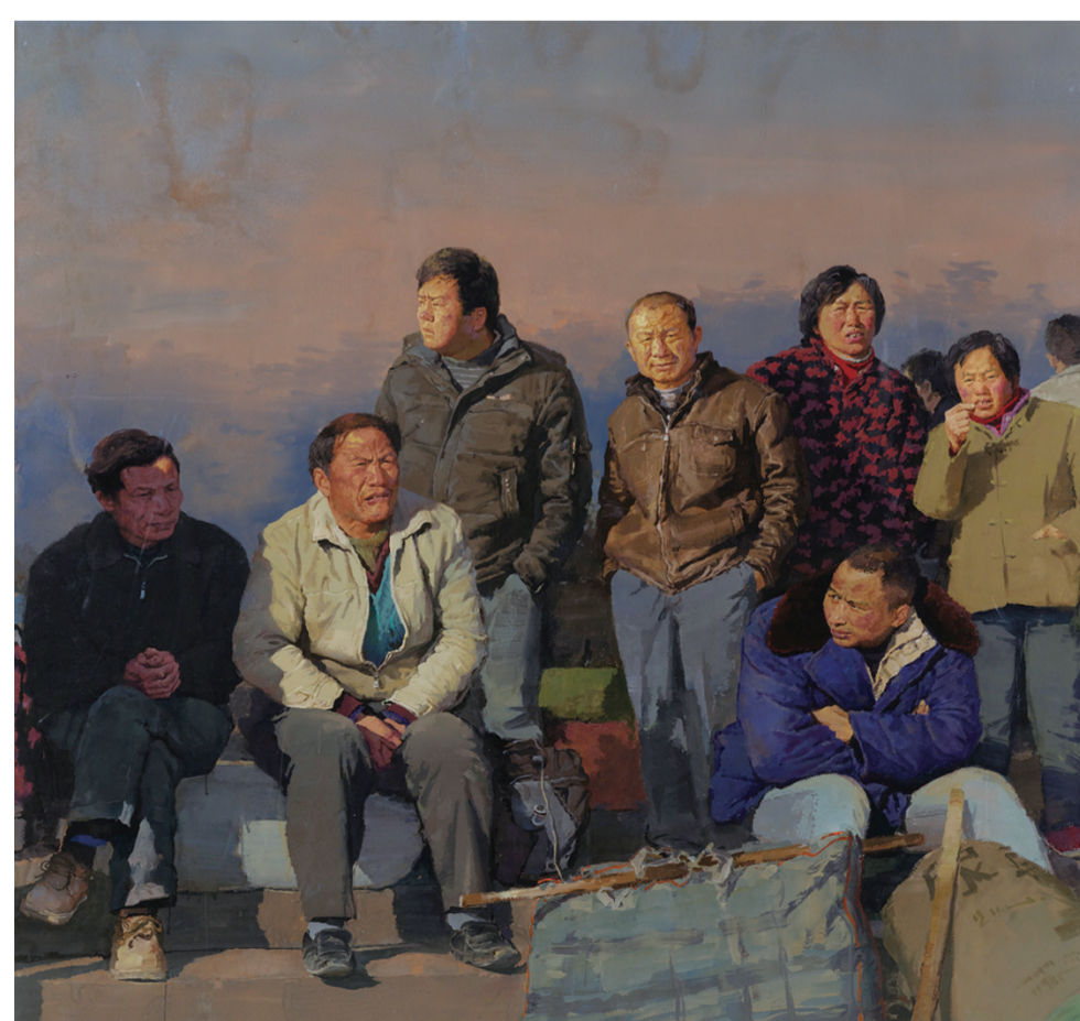
乡愁(水粉) 142×146厘米 路庆龙