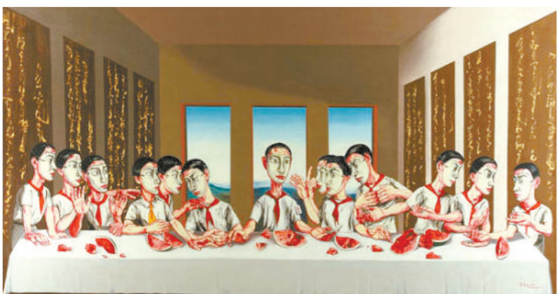
曾梵志《最后的晚餐》

业内人士认为,王刚砸宝事件引发关注,背后的原因正是近年来国内电视鉴宝节目在取得火爆收视率的同时,暴露出鉴定流程不严谨、找托儿上节目等一系列问题。目前适逢《文物保护法》面临修订之际,此案通过司法程序解决争议,既有利于问题的解决,也有利于规范国内鉴宝节目。(金子整理)