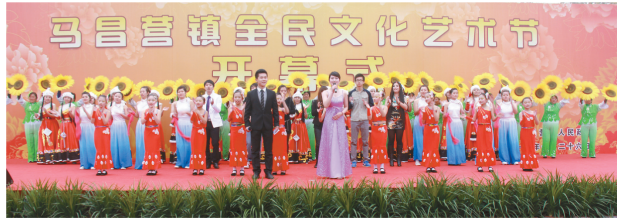
马昌营镇全民文化艺术节开幕式

这些团队不仅能演,而且艺术创作成果更丰硕。2012年,平谷区“乡村大舞台”文艺演出在北京市第22届农民艺术节舞台上荣获大舞台金奖;小评戏《咸淡之间》获金凤凰二等奖;京东大鼓《桃花谣》、戏曲表演《穆桂英挂帅》、歌曲《美丽的心情》、小品《你妈我妈妈》荣获金凤凰优秀奖;北京市第23届农民艺术节期间,平谷区编创的文艺节目新平谷调《幸福平谷》在“乡村大舞台·一村一品”竞赛中荣获一等奖;音乐剧《乐谷之声》荣获第十届中国艺术节群星奖。