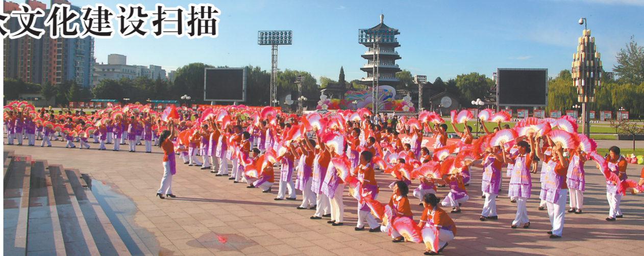
《扇舞翩翩》民间文艺团体展演