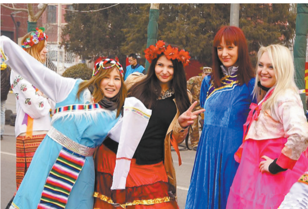
参加平谷秧歌花会大拜年活动的外国游客