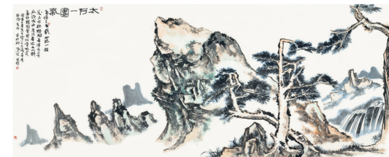
大阿一团气(国画) 梅墨生

11月27日,“从容中道——梅墨生书画诗展·浙江行”在浙江美术馆举行,展出300余幅精品力作,有中堂、条幅、长卷、小品、扇面、手卷等,形式多样,全面展示了梅墨生近年来山水、花鸟、书法、诗词的创作成果。此展是梅墨生“从容中道”系列巡展的第二站。梅墨生,现为中国国家画院研究员。(士凡)