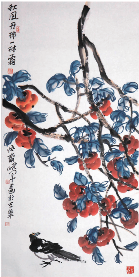
秋丹丹柿一林霜(国画) 李晓军

12月8日,李晓军在中国画精品展郑州天下收藏三省堂画廊开幕,展出李晓军近作写意花鸟画45幅。李晓军是中国国家画院画家、研究员,中国美术家协会会员,中国书法家协会会员,长期从事中国书法和绘画的研究与创作。此次展览同时是三省堂画廊“开门迎客”系列展首展。(楠人)