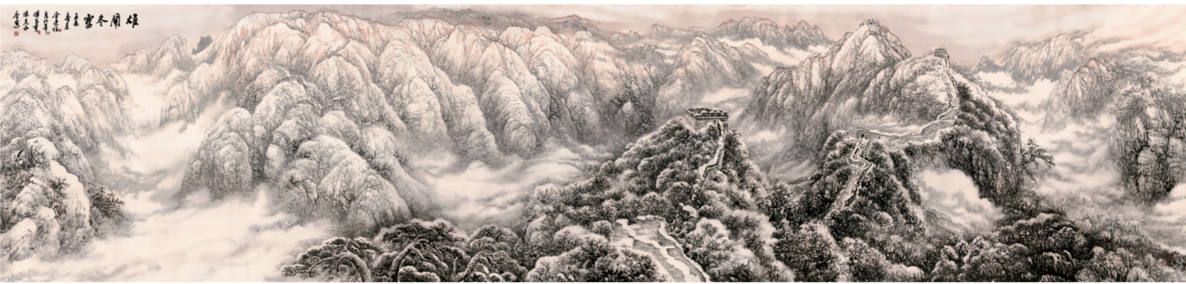
雄关冬雪(国画) 200×800厘米 金连经、高北峰、傅家宝、陈克永合作 傅家宝题

本次展览由北京市文史研究馆、中国美术馆共同举办。为举办这次展览,北京文史馆组织了馆内精干力量,