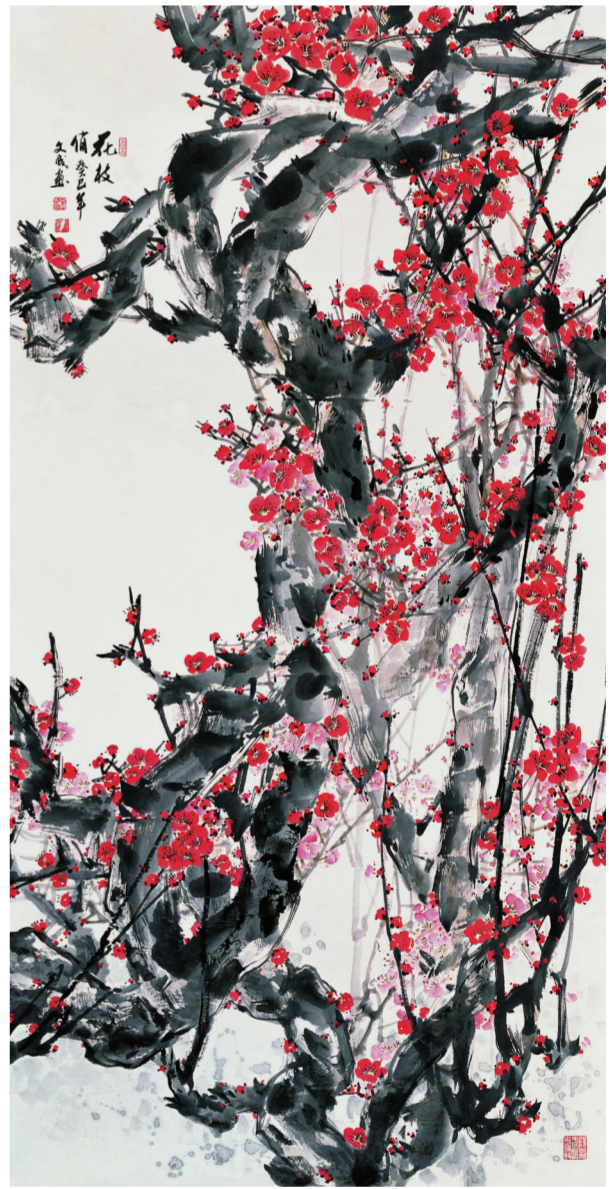
《花枝俏》124厘米×248厘米 2013年