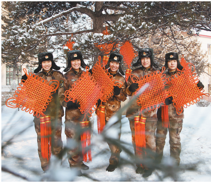
元旦前夕，沈阳军区某装甲旅官兵运用中国结、彩旗、剪纸等，将军营装扮得喜气洋洋，迎接新年的到来。

“右边第一位置转向！”队员们依令左手黄旗平举不动，右手红旗打成水平状态后迅速收回，呈双旗并举状态。官兵手中的红、黄手旗不断交叉变换，每个不同动作都代表着坦克兵在遂行作战任务中的不同指挥口令。他们手旗飞舞，尽显军中男儿儿的刚毅；他们朝气蓬勃，焕发出铁甲勇士的激情。