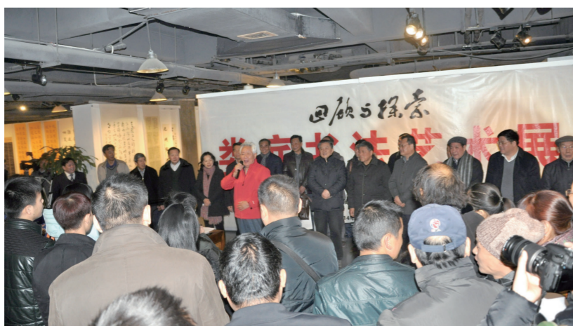
“回顾与探索”艺术展开展仪式

据悉，本次展览筹备历时半年，广泛发动全市书法爱好者，共征集作品500余件，遴选出160余件作品，诸体兼备、形式多样、情趣各异，既有深厚的传统功力，又展示了时代审美和个性；既有“二王”书风体系的研习与活用，又有汉魏碑刻金石书风的追慕与变化；既有榜书的厚重跌宕，也有手札的精致流美，篆刻作者们借秦汉之风，抒流派之雅，向观众展现了方寸之间的万千气象，从不同方面沿袭和传承着尊重传统、重视个性、提倡多元的湖湘书风的精神内涵，较全面地展示了娄底书法目前的创作水平和方向，参展作者们用书法艺术表达奋发向上的热情，传承古老文化的巨大魅力，彰显娄底在新时代的人文精神。