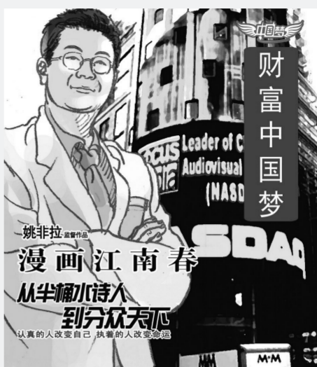
《财富中国梦》 杭州夏天岛影视动漫制作有限公司

由文化部联合其他7家单位共同举办的“中国梦”主题手机(移动终端)动漫创作活动已落幕,20部风格迥异的作品从3000多部参赛作品中脱颖而出,本版选择了10部作品,与君共赏。本期是5部手机漫画作品,下期将是5部手机动画作品。