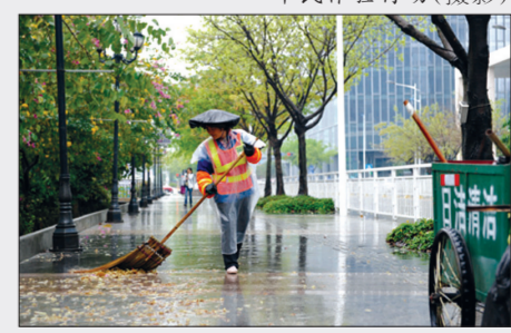
城区新貌行动(摄影)