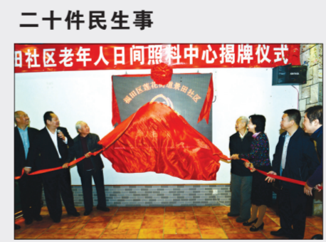
老人日间照料中心(摄影)