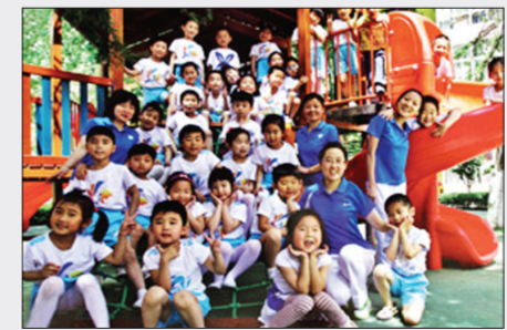
建20所普惠制幼儿园(摄影)