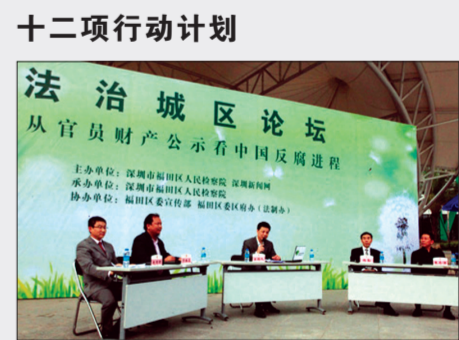
社会管理法治行动(摄影)