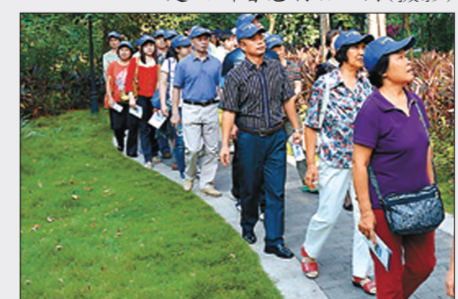
福荣绿道二期拓展工程建设(摄影)