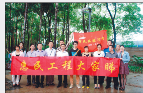
市民体验行动(摄影)