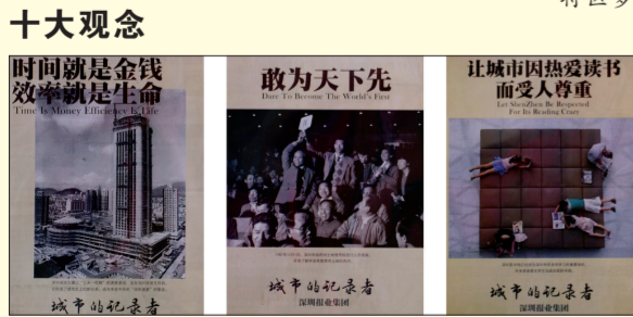
效率梦 敢闯梦 读书梦