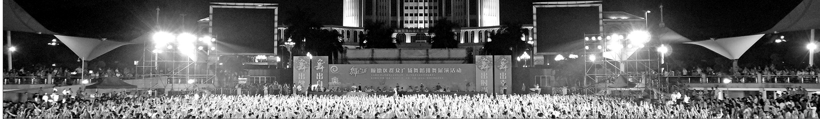
“幸福顺德·百姓舞台”顺德区排舞大赛在德胜文化广场举行,统筹区级文化活动并在德胜文化广场集中展示是顺德区文化艺术发展中心以广场为核心着力打造都市文化高潮区的重要举措。

尽管广东省佛山市顺德区历来有改革的优良传统,但2012年9月的一项改革,还是掀起了千层浪。其时,顺德区在文化艺术领域开展法定机构试点,成立了顺德区文化艺术发展中心(以下简称文艺中心),实行法人和理事会制度,承接政府的公共文化服务职能,成为全国首批文化领域改革的法定机构,不仅形成了“大文化”的初步格局,也实现了文化建设“管办分离”。近日,记者来到顺德,感受到了顺德文化体制改革的喜人变化,看到了法定机构成立一年多来所取得的骄人成绩。