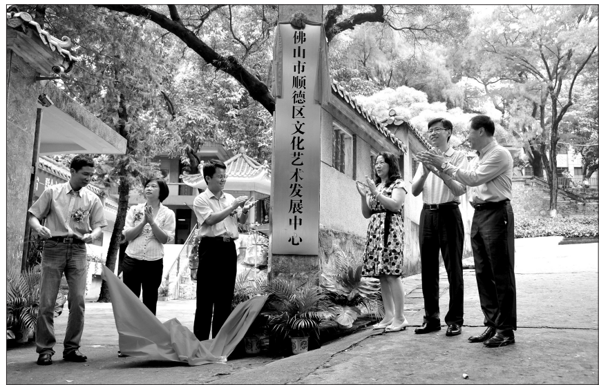
2012年9月25日,顺德区文化艺术发展中心揭牌。