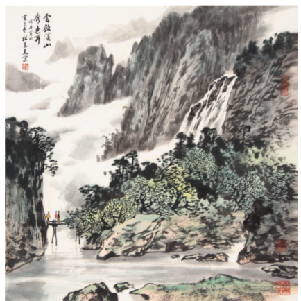
云敛溪山秀色开(国画) 杜高杰