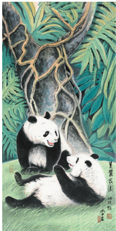
美丽家园(国画) 刘中