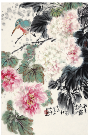
绿树红芳(国画) 刘伽郡