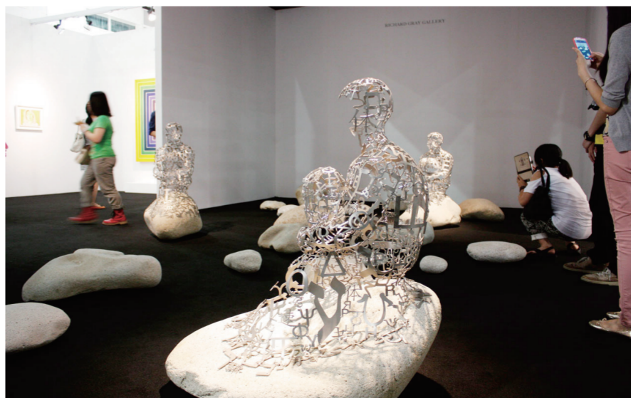
香港巴塞尔艺博会现场