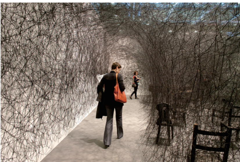
迈阿密巴塞尔艺博会现场

事。艺术博览会在国内发展一直都很缓慢,但去年出现的多种形式的艺博会为业界增添了新生力量,艺博会不拘一格的发展途径或许会为国内艺术品市场带来新气象。随着2013年国内诸多形式当代艺术博览会的出现,艺术品市场着实“火爆”了一把。虽然亚洲艺术品市场的核心依然在香港,但随着ART021等一批创新模式的艺术博览会的出现,这些后来者似乎迅速获得了内地市场的青睐,而今后过程也必然是艰辛的,国内艺博会能否在未来占据一席之地,还必须敢于进行一番大胆的创新。