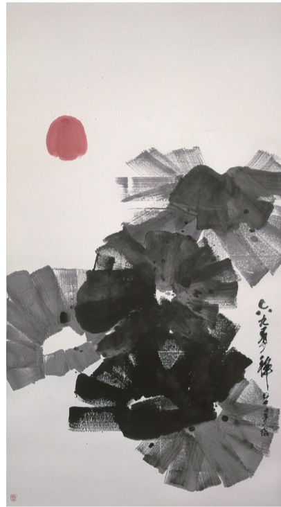
吕寿琨《禅画》设色纸本 1969年

香港苏富比推出名为“聚——当代文人艺术”的专场,可视为香港苏富比对当代水墨专场的一种扩充。该专场将赏石、盆景、根雕摆件等与当代水墨