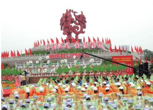
“吴韵汉风 金陵畅想”南京群众晒歌会