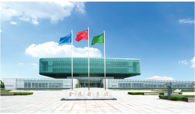
金陵图书馆(南京市图书馆)