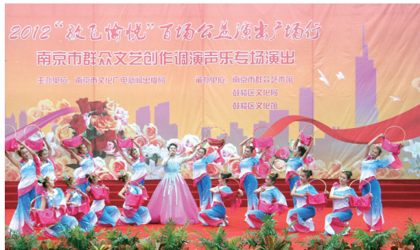
2012年南京市群众文艺创作调演声乐专场演出