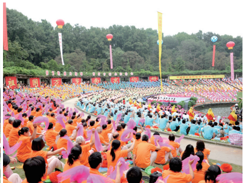
爱国歌曲大家唱——南京市群众赛歌会