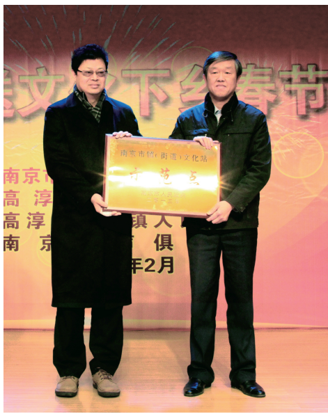
2014年2月12日,南京市文化广电新闻出版局组织到高淳区东坝镇开展送文化下乡慰问演出活动,南京市副市长陈刚在慰问演出活动现场向刚刚成功创建成为市级“示范文化站”的东坝镇文化站授牌。

高水平的公共文化服务体系离不开丰富多样的文化产品和多姿多彩的文化活动支撑。南京一系列持续多年精心打造的文化活动参与面广、受益者众,品牌效应日益彰显,深受广大市民百姓喜爱。“百场公益演出广场行”是南京市政府重点打造的文化惠民品牌活动,由南京市委宣传部、市文广新局主办。百场公益演出广场行活动自2007年起举办,每年一主题,年年有亮点,年年有创新。百场公益演出广场行活动以“文化惠民”为宗旨,以文化广场为载体,组织专业和业余文艺团体在全市组织广场演出100场,面向基层,服务群众,努力为广大市民提供更多更好的文化产品。据统计,受益人数已达500多万。该项目已成为群众参与度、受众面广的文化精品项目。2009年被评为南京市政府为民办