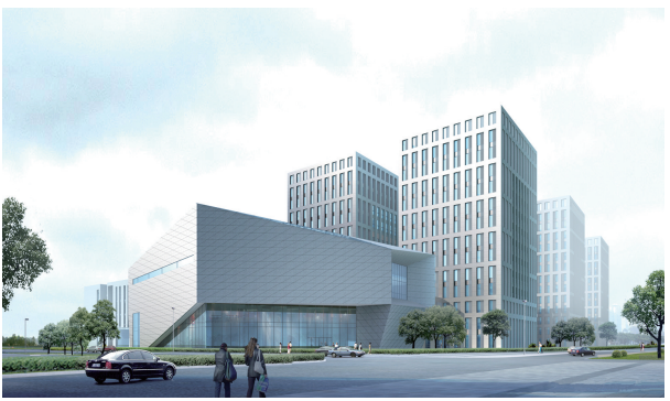
即将投入使用的建邺区文化艺术中心