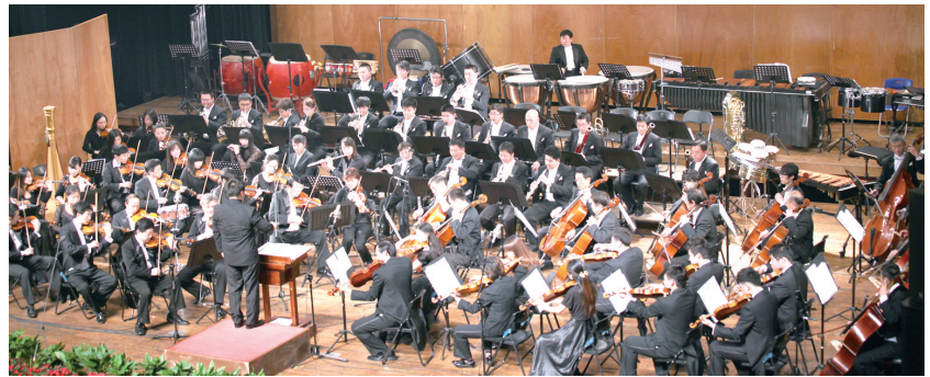
南京市文化惠民活动——公益交响音乐会

群众的文化需求就是公共文化服务不断努力的方向。“百千万行动计划”吸引和凝聚各方资源共同参与,统筹计划,统一实施,充分调动群众参与文化建设的积极性、主动性和创造性,提升了公益性文化活动的社会效益。据南京市文化广电新闻出版局局长刁仁昌介绍,“百千万行动计划”的探索和实践产生了很好的社会反响,抓主题,创品牌,“百场演出”得民心,“欢乐和谐”“收获幸福”“共享华诞”“感受欢歌”“享受阳光”“放飞愉悦”“点燃梦想”等演出主题达到了互动共鸣的效果。抓特色,带基层,千场演出展风采,“百千万行动计划”将基层群众文化活动纳入其中,各区根据各自的文化特点,形成了“一区一品”,打造出了具有区域特点的群众文化活动品牌。如:建邺区的“精彩365 快乐每一天”“幸福鼓楼”“魅力雨花”“江宁之春”“秦淮之夜”等活动遍地开花。全市从城市到乡村,基层文化活动呈现出前所未有的生