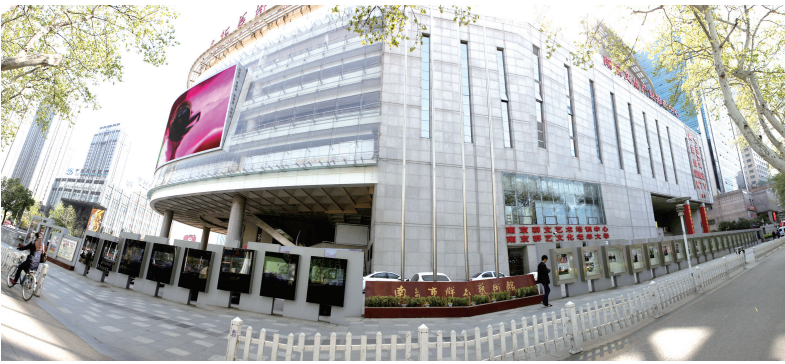
南京市群众艺术馆