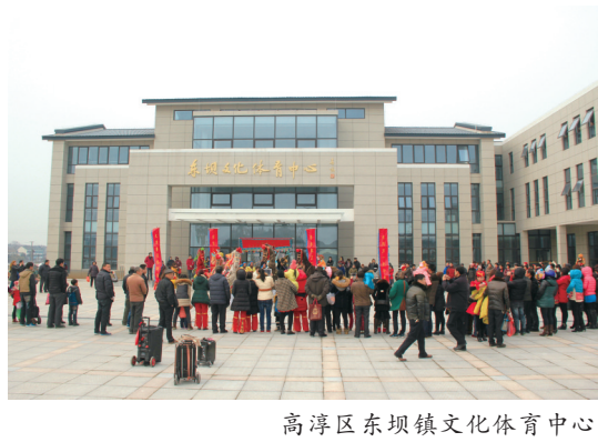
高淳区东坝镇文化体育中心