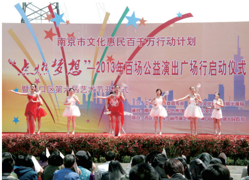
2013年南京市百场公益演出广场行启动仪式