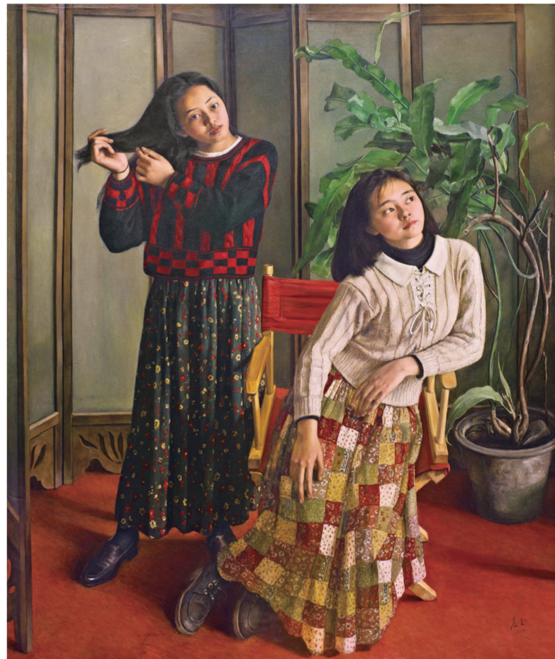
妙龄女(油画) 194×162厘米 1996年 杨飞云

本报讯（记者高素娜）日前，2014年“艺术北京”博览会在全国农展馆闭幕。据艺术市场分析研究中心（AMRC）的统计数据，今年博览会的参展机构逾180家，作品销售火爆，成交量达1000余件。其中，成交作品均价约15万元，5万元至30万元价格区间的作品成交最为活跃。记者在现场发现，此次博览会中来自上海的参展机构是历年来最多的一次，包括香港纳画廊、卡哇度艺术空间、罗浮紫艺术典藏、奥赛画廊等近30家。它们带来了绘画、雕塑、装置及艺术衍生品等，作品风格也多样丰富，既有当代水墨、当代油画，也有经典写实油画、国画等。记者注意到，博览会闭幕时，很多作品都贴上了已售的标志。其中，去年在上海艺博会上畅销的旅日油画家孙家珮的表现非常抢眼，其细腻、精致的画风受到许多藏家的欢迎。而首次亮相艺术北京的画家陈强作品，也凭借其文人画的笔墨趣味取得了好成绩。“我们非常看好北京的艺术市场，北京的文化氛围非常浓郁，藏家也很多，这次的‘上海军团’大都取得了不错的成绩，相信以后会更注重北京市场。”上海卡哇度艺术空间总经理胡晓芒说。