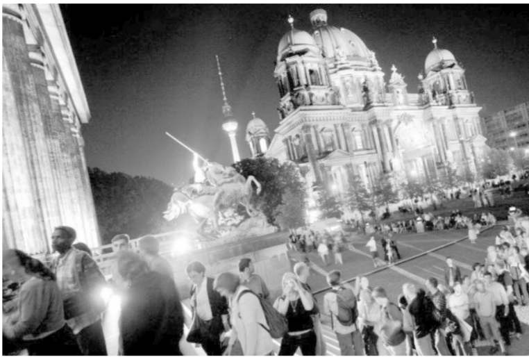
柏林市民在老博物馆前排起长队参加“博物馆长夜”活动

始建于1914年的拜占庭和基督教博物馆坐落在雅典瓦西里西斯·索菲亚斯大道。这里收藏了超过2.5万件罕见的拜占庭时期基督教艺术品,包括经文、壁画、陶器、丝织品、手稿等。人们可以通过价值连城的艺术品了解拜占庭和后拜占庭文化。5月12日,该馆举行了丰富多彩的庆祝活动,进一步传播拜占庭文化,其中包括策划新的永久性展览。该馆相关负责人介绍,这些展览还将介绍博物馆的建设、文物保护、展览策划作出贡献的老一代专家以及该馆在传播拜占庭文化方面所起到的作用和影响力,为大众提供深入了解拜