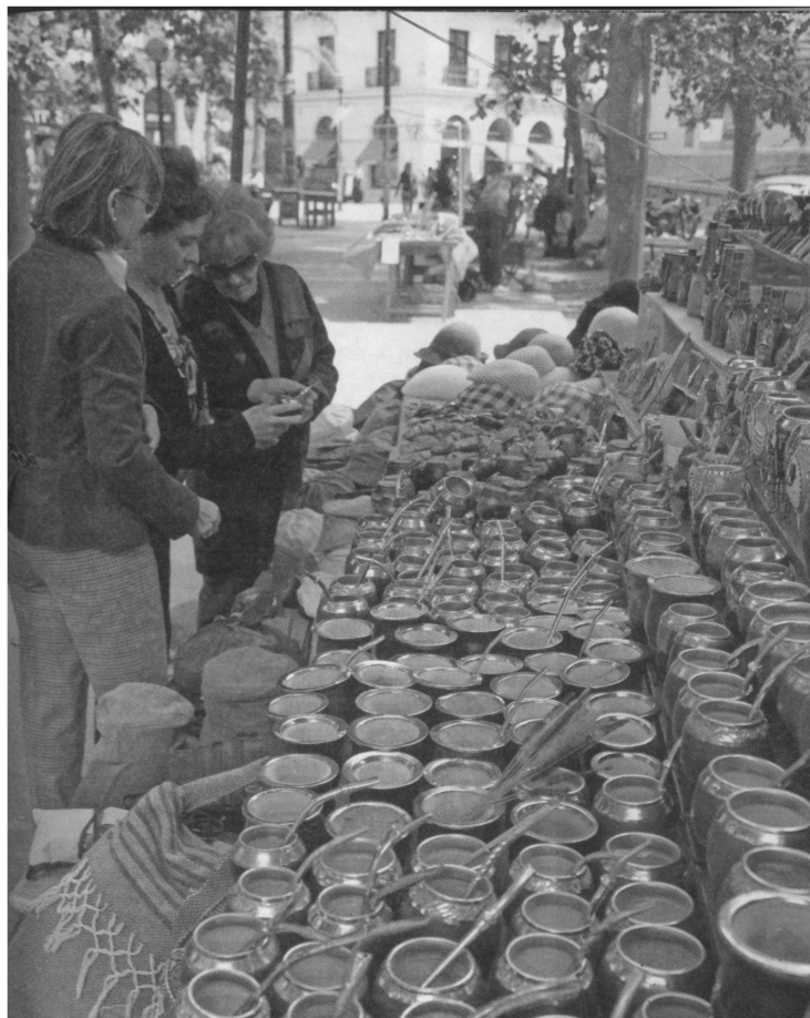
市民在购买马黛茶茶具

在乌拉圭随机抓拍的不少人像照片中,腋下夹着小暖瓶、手持简易马黛茶具的人物形象比比皆是。马黛茶的茶具,也已成为乌拉圭人须臾不可分离的终身伴侣。