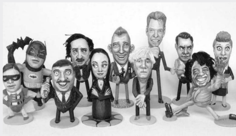
花生壳拼出逼真人像

为了给作品增加乐趣,卡西诺故意保留作品的背面,让人看得出是生活中常见的花生壳。卡西诺以音乐、电影等文化领域的名人为创作对象,小小的一个人像往往需要10个小时才能完成。