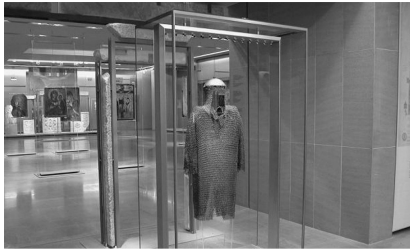
拜占庭和基督教博物馆内景

1977年,国际博物馆协会向全世界宣告1977年5月18日为第一个国际博物馆日,数十年来,这一节日让更多的民众了解并走进博物馆。今年5月18日,以“博物馆藏品架起沟通的桥梁”为主题的国际博物馆日活动将在各国展开。今年的主题强调博物馆是根植于现在、保存与沟通过去的机构,将世界各地的观众、各代人与他们的文化紧密联系起来,让人们更好地理解他们的根源与历史。