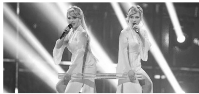
俄姐妹花进入「二〇一四欧洲电视歌唱大赛」决赛

因此否定他的歌唱才华。最终,沃斯特以一曲《如凤凰升起》赢得了290分的高分,高出第二名荷兰选手50多分。沃斯特在得奖后表示,自己想要告诉人们,如果做自己并且相信自己,就将能够达成任何事情。类似充满个性的表演在本届大赛中俯拾即是。波兰女歌手身着改造后的传统服装跳起洗衣舞;乌克兰女歌手的伴舞在舞台上玩儿起了真人版仓鼠转轮;匈牙利歌手用一曲《逃亡》表达对虐待儿童的不满……观众对这些表演的褒贬不一,但可以肯定的是,在欧洲电视歌唱大赛的舞台上,众歌手的创意和才华都能得到最大限度地展现。