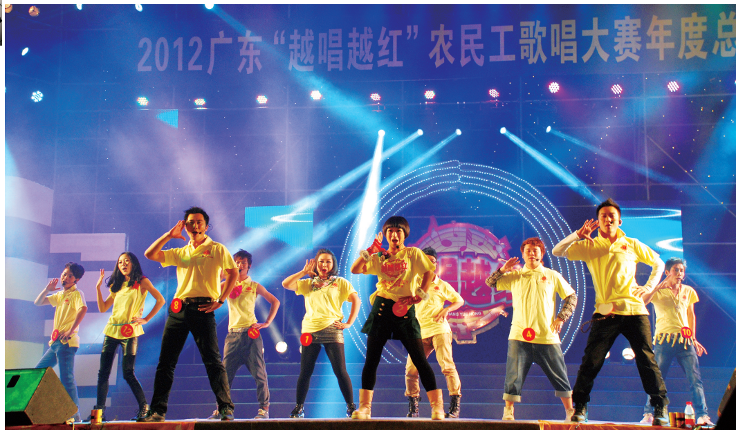
国家级特色广场活动品牌“越唱越红”歌唱大赛