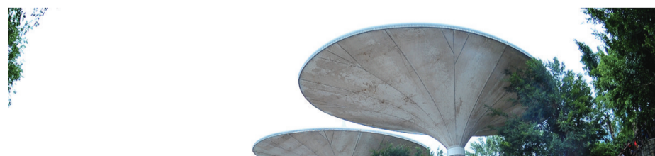
东部华侨城度假区“咆哮山洪”游客满座

“发展是旅游的灵魂,旅游是文化的载体。”在文化之初,华侨城人就深刻认识到这一点,并始终践行。以华侨城文化旅游的重要部分主题公园为例,在深圳这个既无名川大山又无秦砖汉瓦的城市,华侨城把主题公园