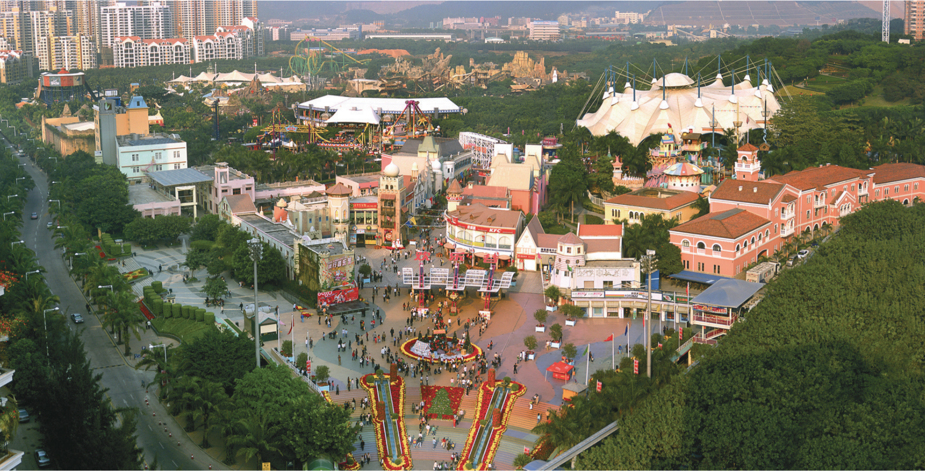
深圳欢乐谷广场俯瞰图

深受广大孩子喜爱的深圳欢乐谷,今年首次作为分会场参展文博会,以魔术为主题,在以往魔术节的基础上进行丰富,