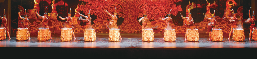
北京欢乐谷剧目《金面王朝》

如今在新的形势下,文化创意和设计服务与相关产业融合发展成为国家重要战略,华侨城将依托现有平台,以金融和科技作为动力,以开拓者的坚韧不拔、领军者的高瞻远瞩、驱动者的孜孜不倦,一如既往地引领行业发展,为国人畅想更加优质的生活。