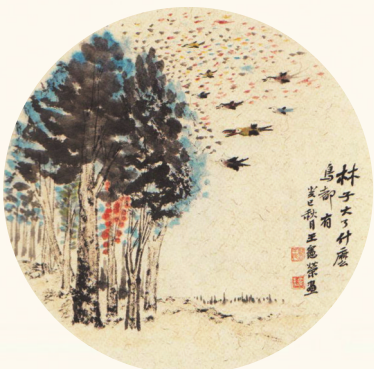
《林子大了什么鸟都有》