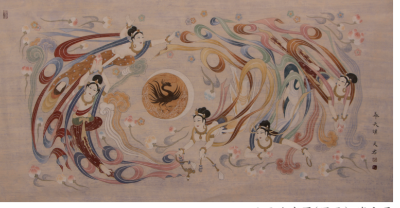
飞天迎宾图(国画) 谢文君