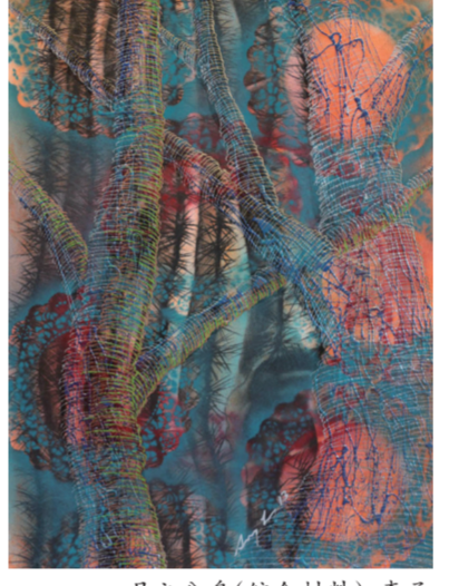
月之分身(综合材料) 李承

日前,“存在即记忆”何晋渭、李承双个展在北京798新绎空间开展,共展出作品70余幅。作品紧扣“从记忆的根源探讨乡愁的价值”的主题,该提时的丰富境遇使两位成长于不同文化背景的艺术家的迸发出了相同的创作源泉与精神动力。展览将持续至6月23日。(天颖)