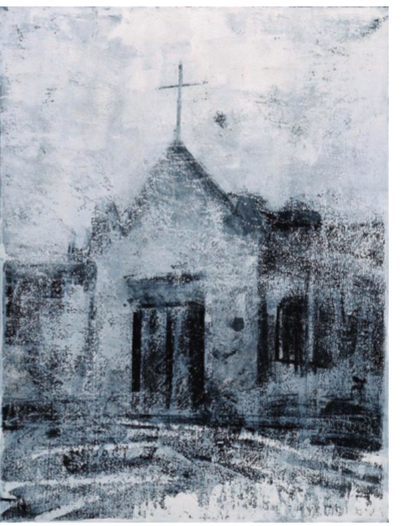
故乡行—春风(油画) 何晋渭