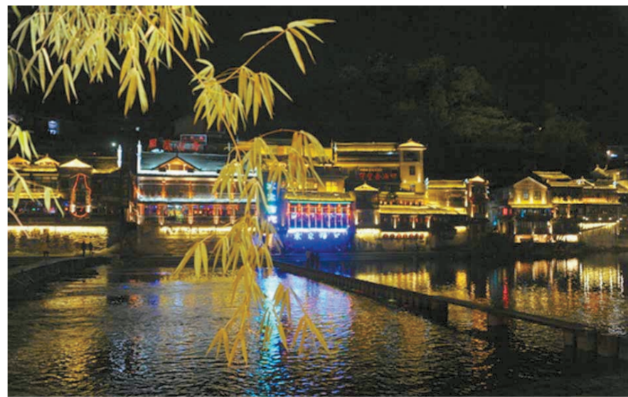
湘西凤凰古城夜景

多少爱在心头 多少梦萦绕身边 落花香随流水缠绵 袅袅云烟驻永恒的依恋 彩虹在天边雨儿在眼前 千年相思 相思千年