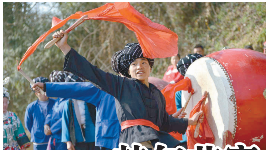
打起苗鼓迎客