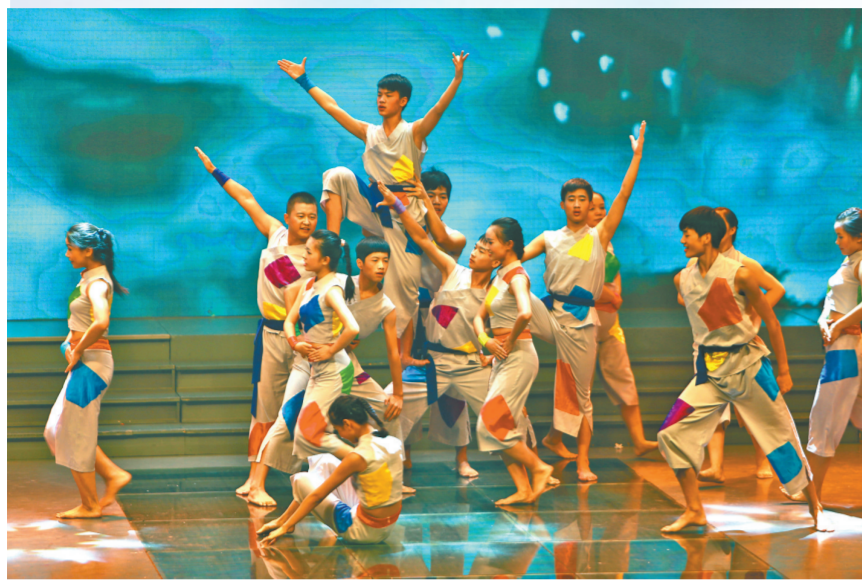
《南岳山歌风情》舞出秀美“南岳风”