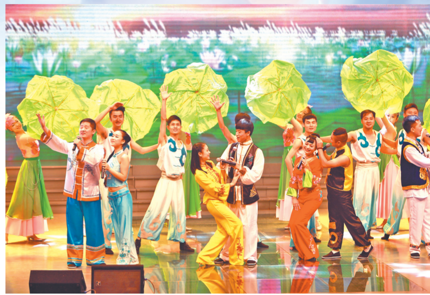
民俗民歌对唱《幸福花常开》将幸福传向四方

耳熟能详的乡村小调、催人泪下的歌剧故事、醇香古朴的风情舞蹈……8月19日下午，衡阳群众企盼已久的文化年度盛宴——“欢乐潇湘·幸福衡阳”大型群众文艺汇演决赛掀起了雁城欢歌笑语的热浪。从今年3月以来，衡阳广泛开展了“欢乐潇湘·幸福衡阳”大型群众文艺汇演，将群众文艺活动的舞台搭在社区广场、田野乡间，搭在老百姓的家门口、心坎里，让群众成为文化的主人、活动的主角，这场“离群众最近”的文化盛宴，为雁城带来满目春风。