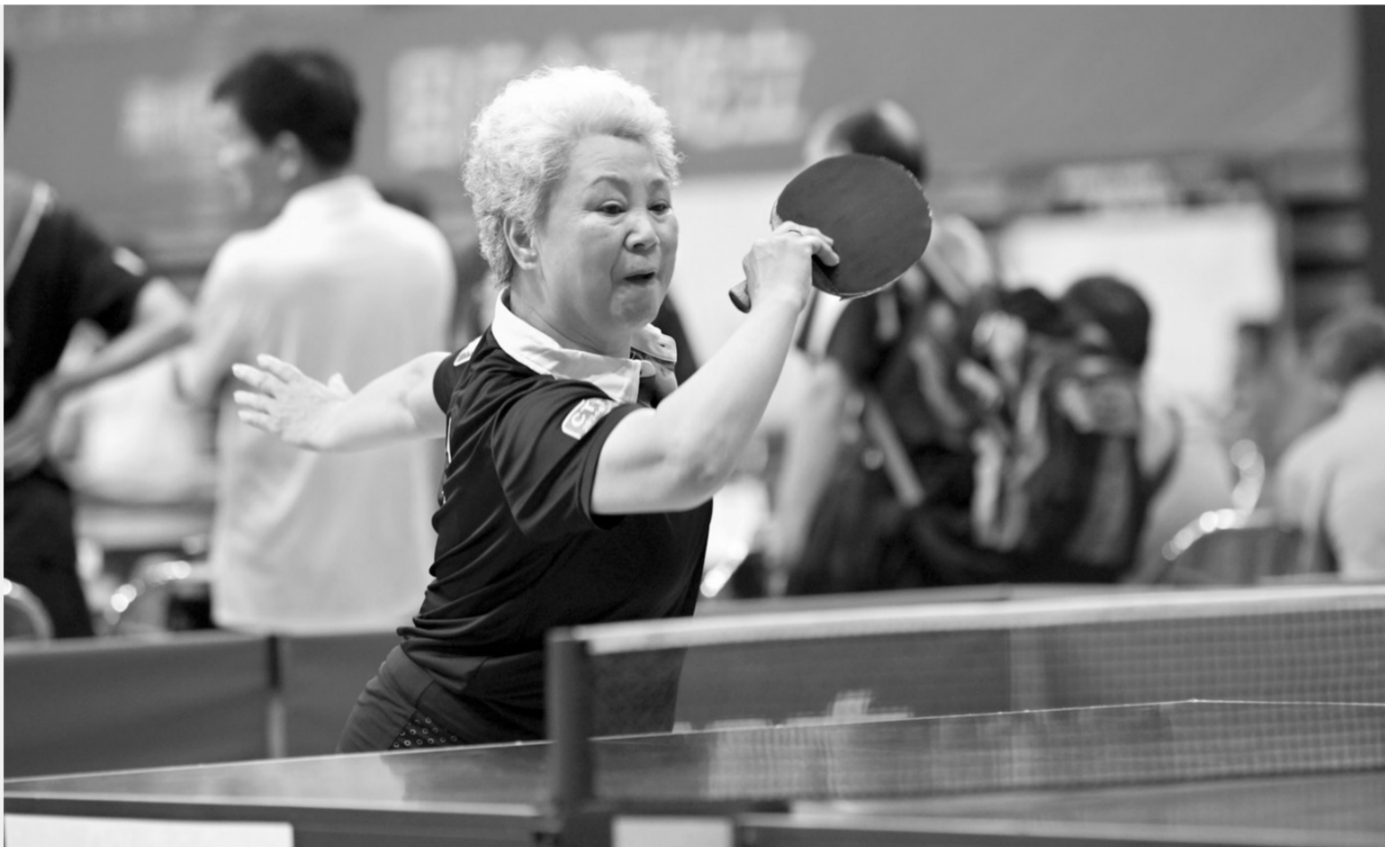
“相约苏州世乒赛·李红双喜杯”2014年中国乒乓球协会会员联赛宝安站比赛近日在宝安体育馆落幕。