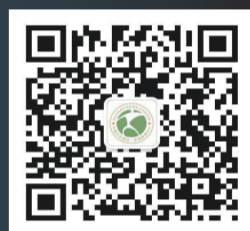
扫一扫，关注更多文化资讯