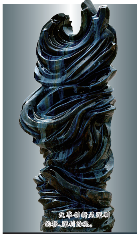
改革创新是深圳的根、深圳的魂。

2010年8月，深圳经济特区建立30周年之际，深圳举办了“深圳最有影响力十大观念”评选活动，经过两个月的筛选，“时间就是金钱，效率就是生命”“空谈误国，实干兴邦”“让城市因热爱读书而受人尊重”等人选“深圳十大观念”。