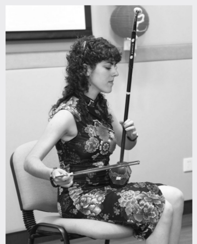
二胡独奏《小花鼓》

本报讯 (驻马耳他特约记者孙燕)8月21日,马耳他中国文化中心二胡培训班学员结业音乐会在该中心多功能厅举行。结业音乐会既是展