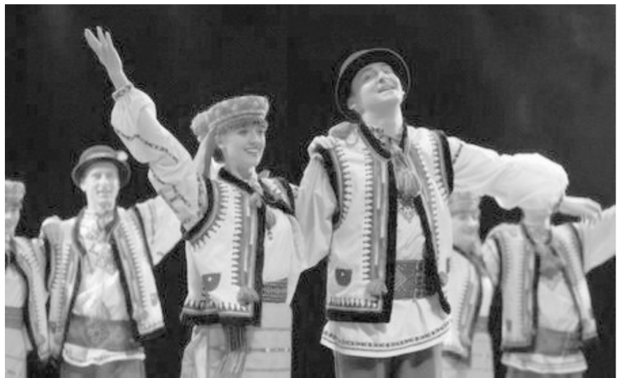
波兰文化节在中国举办(资料图片)