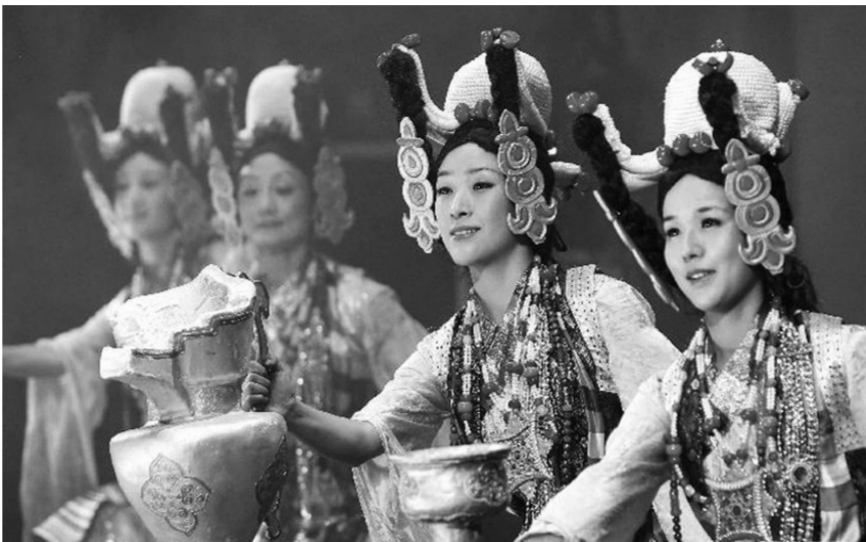
西藏歌舞在波兰演出(资料图片)

位于欧洲中部的波兰有着深厚的历史文化底蕴,享有国际声誉的天才作曲家、钢琴家肖邦正出自这个国家。近年来,文化作为国家软实力的重要体现受到波兰政府的重视。早在2008年,中国就被波兰政府设定为文化推广的重要对象国之一。随着中国经济的不断发展,波兰越来越重视对中国进行文化推广,并由此实现以文化交流促进政治、经济的全面合作。