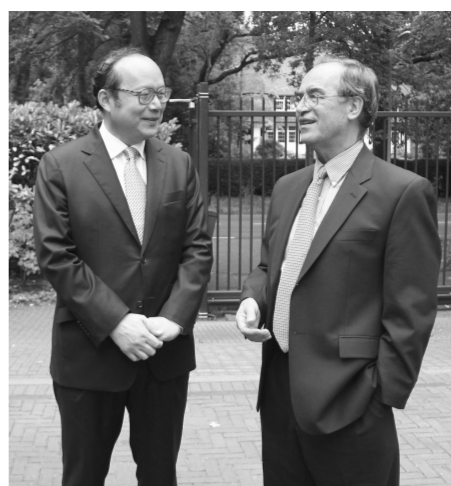
荷兰汉学家伊维德(右)与中国驻荷兰大使陈旭交谈

为加强与中国汉学界的联系、促进两国人文思想层面的深度交流,世界知名荷兰汉学家伊维德(Wilt Idema)教授应中国对外文化交流协会邀请,由中国文化传媒集团具体负责,于9月8日抵达北京参加“东方文化研究计划”,开启自己的访华之旅。