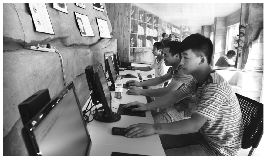
农家孩子在北碚区施家梁镇泉湖文化大院通过“碚壳”平台浏览北碚美术馆数字展览。

据悉，北碚区依托国家数字惠民工程和图书馆总分馆工程，与市图书馆和国家图书馆实现虚拟资源共享，全区所有镇街综合文化站实现通借通还，并延伸到部分村(社区)文化室。以“一卡通服务中心+若干镇街服务点”为管理模式，打造建设、管理和服务一体化的三维管理体系，打通国家、市、区、镇街、村社五级图书网络流通资源共享渠道，建设居民学校、宣传阵地、娱乐中心、创作基地、精神家园五大功能板块，实现把海量书籍送到全区百姓家门口的目标。